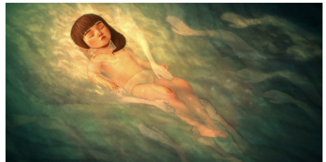
Pachyderme de Stéphanie Clément. Soirée Carte blanche à SudAnim.

Réservation conseillée auprès du cinéma : artplexe-canebiere.com