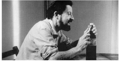
Essai d'ouverture de Luc Moullet.

Infos et réservation sur le site du cinéma : labaleinemarseille.com