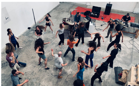
Soirée Transe et Sentiments .

En partenariat avec Les Ateliers Cinéma et 529 Dragons.