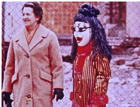
Image du Carnaval de Bâle de Robert Cahen & Michel Karlof. Ciné-conférence Le Carnaval, une subversion des formes filmiques , animée par Federico Rossin.