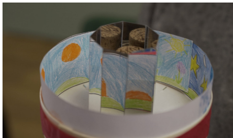
Atelier À la découverte des origines du cinéma, mené par l'association In Medias Res .

Atelier proposé et animé par l'association In Medias Res : https://inmediasres.fr Réservation obligatoire : dgac-jeunesse-bmvr@marseille.fr