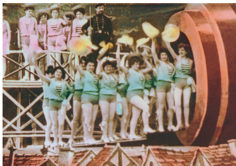
Le Voyage dans la Lune de Georges Méliès. Projection Le cinéma c'est fantastique.

Depuis ses débuts, le cinéma nous fait voyager dans des mondes irréels. Une séance pour remonter le temps à travers 6 courts métrages cultes de la première moitié du XX e siècle.