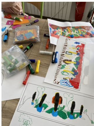
Atelier hors les murs à la MECS de l'Arbois

Le musée propose des visites et des ateliers à destination des primo-arrivants, demandeurs d'asile de l'association Agir et d'autres associations présentes sur la région. Les visites sont adaptées en fonction du niveau de langue de chacun et peuvent être conçues sur mesure.