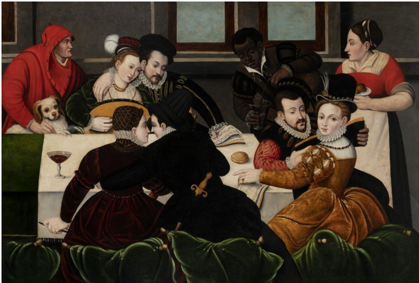
Anonyme de l'École de Fontainebleau, Le Repas galant , XVI e siècle © musée Granet.