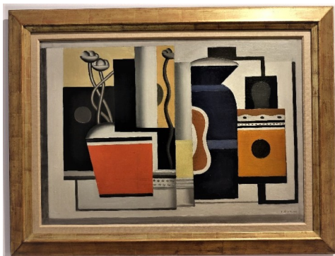
Fernand Léger, Le Pot rouge, 1926, huile sur toile