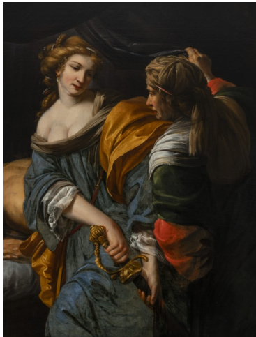
Giovanni Battista Spinelli, Judith se préparant à trancher la tête d'Holopherne , vers 1650, huile sur toile

Suite à l'exposition « Naples pour passion, chefs-d'œuvre de la collection De Vito » (15 juillet – 29 octobre 2023) le musée Granet prolonge la monstration de son fonds de peintures napolitaines du Seicento . Cet ensemble remarquable permet de se saisir de l'importance et de la complexité de la production napolitaine de l'époque.