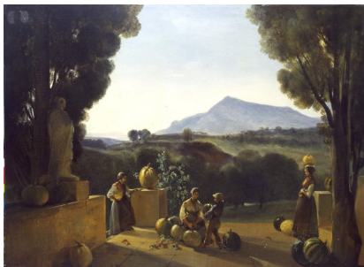
François-Marius Granet, La récolte des citrouilles à la bastide du malvalat , XIX e siècle.

Une grande salle est consacrée au peintre aixois François-Marius Granet, illustrant principalement la période romaine de l'artiste, avec notamment le portrait de son ami Ingres. Ce dernier se retrouve dans la salle suivante avec le monumental Jupiter et Thétis accroché dans l'espace néoclassique du musée et entouré d'autres œuvres à thématique mythologique. Une dernière salle propose un panorama des peintres provençaux du XIX e siècle qui ont su magnifier le paysage de leur région. Cet espace se situe au niveau +1 du musée.