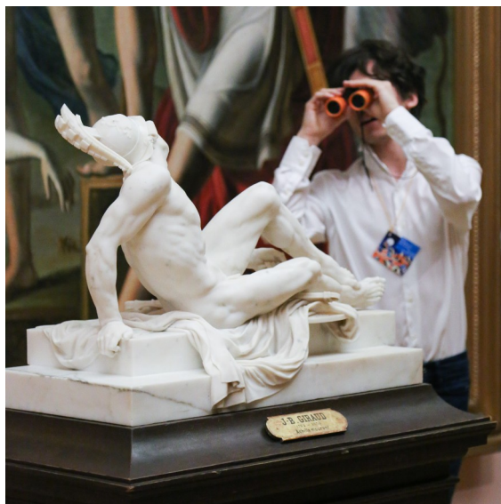
Vue de la Galerie XIXe

Pour toute information ou prise de réservation, vous pouvez contacter le service réservation du musée au 04 42 52 87 97 ou par mail à : granet-reservation@mairie-aixenprovence.fr .