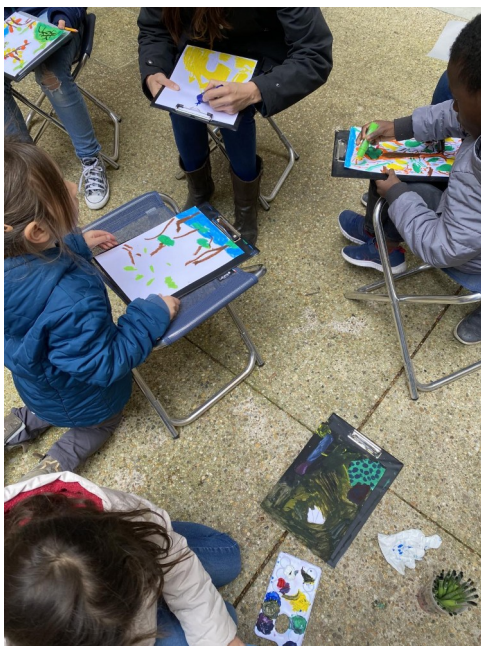
Atelier collectif autour de l'exposition David Hockney

Une restitution de ce projet aura lieu dans l'auditorium du musée à l'occasion des Journées du patrimoine, les 16 et 17 septembre 2023.