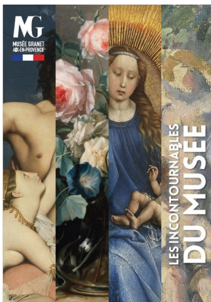
Livret "Les Incontournables du musée"

D'autres outils payant vous permettent de découvrir les collections : audioguides et visites guidées individuelles. Ces prestations sont à demander à l'accueil du musée.