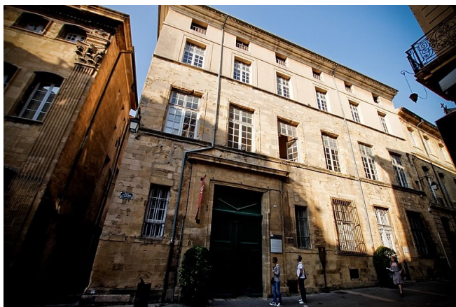
Hotel de Châteaurenard

Si vous êtes intéressé, vous pouvez contacter la médiatrice référente.