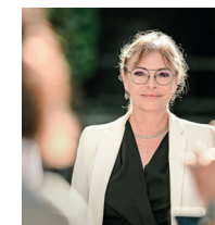
Sophie Joissains Maire d'Aix-en-Provence Vice-présidente de la Région Provence-Alpes-Côte d'Azur

Je vous souhaite à tous un joli Mois de l'Europe 2024, riche en rencontres et moments de partage.