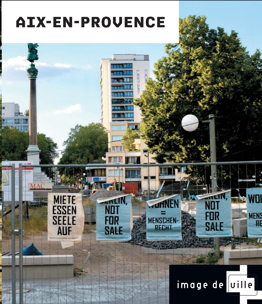
image de ville