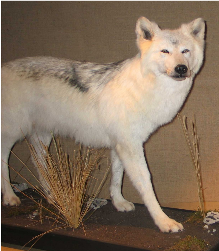
Loup du Canada

Le Muséum d'Aix possède 4 spécimens de loup gris : 2 de la forme américaine et 2 « français » de la souche italienne. Parmi les loups américains, un au pelage blanc ( Canis lupus occidentalis ) a vécu au zoo de Haute-Touche (Indre) mais est un descendant d'animaux sauvages originaires du district de Mckenzie au Canada. Ce loup est beaucoup plus massif que les loups européens. Parmi nos spécimens français, une femelle, originaire d'Abriès dans les Hautes-Alpes, a été malheureusement tué après avoir été percutée par une voiture. Si au niveau mondial l'espèce n'est pas menacée, en France le loup est protégé.