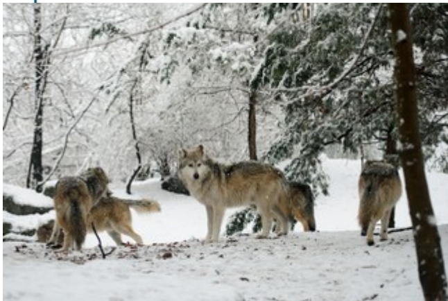
Meute de loups

Le loup est un animal social qui vit en meute de 5 à 11 individus sur un territoire qui varie de 200 à 400 km 2 en fonction de l'abondance des proies. Le groupe est mené par un couple reproducteur qui peut avoir 4 à 8 louveteaux par portée. Ce prédateur peut s'attaquer à des proies de toute taille allant du lièvre au chevreuil et jusqu'à des animaux plus imposants comme le cerf élaphe, l'élan ou le bison.