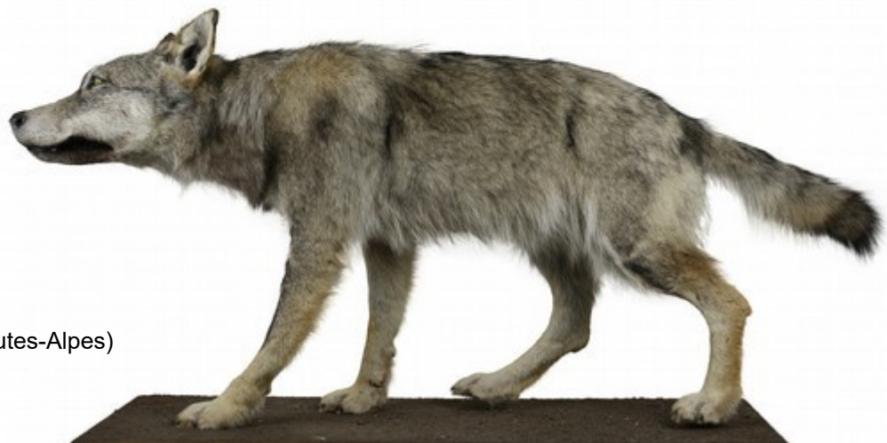
Louve d'Abriès (Hautes-Alpes)