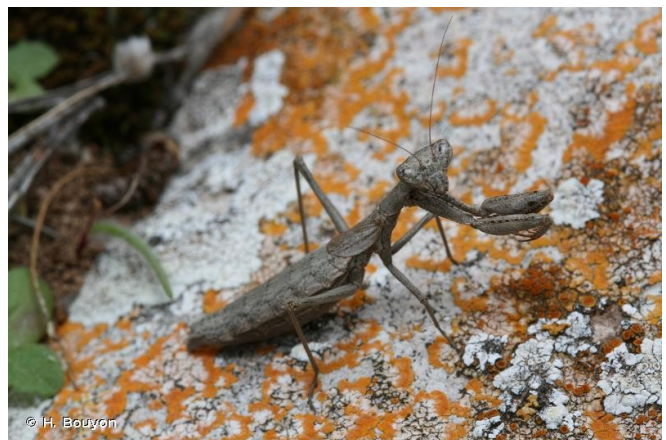
Mante colorée ( Ameles decolor )

En France, nous sommes 9 espèces ; 8 en région PACA et 6 dans les Bouches-du-Rhône. Et oui on aime la chaleur, les milieux secs, ensoleillés et les endroits découverts. Nous ne vivons pas toutes dans le même milieu : les Mantes religieuses, les Mantes ocellées ( Iris oratoria ), les Empuses pennées ( Empusa pennata ) vont préférer les herbes et les arbustes. Les plus petites espèces comme la Mante décolorée ( Ameles decolor ) et la Mante d'Etrurie ( Ameles spallanziana ) seront près du sol, dans les buissons. Alors que la Fausse-Mante ( Geomantis larvoides ) vit au niveau du sol, à des endroits avec très peu de végétaux.