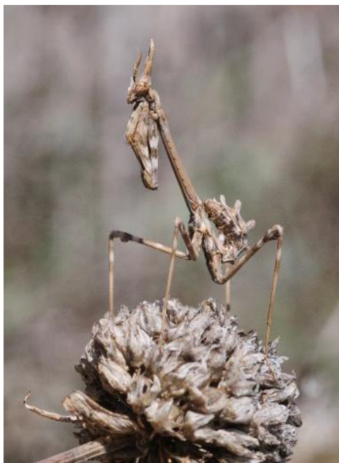
Empuse pennée ( Empusa pennata ) © A.H. Paradis & H. Poncet uvie