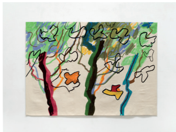
Au matin Tapisserie basse lisse 2017/2021 143 x 200 cm 100% laine Etel Adnan © The state of Etel Adnan Courtesy Galerie Lelong & co Au matin . Low-warp tapestry 2017/2021 4,7' x 6,5' 100% wool Etel Adnan © The state of Etel Adnan Courtesy Galerie Lelong & co

Etel Adnan is a prolific artist whose abstract paintings abound with light and sun patterns like children's drawings. Over the years, this lucid and generous philosopher has become an icon in the art world.