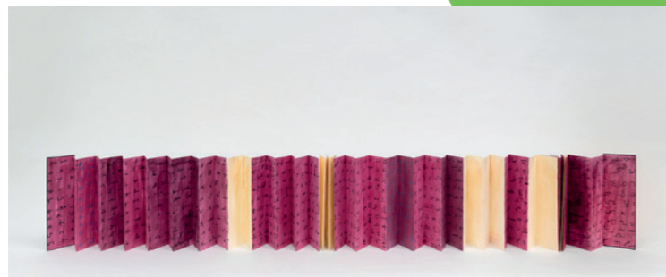
The World of Signs , 2019 Lavis et encre sur livret 29 x 9 x 520 cm W23012 « Réalisé par Etel Adnan à la demande de Pierre Audi pour le décor de sa production de L'Apocalypse arabe »