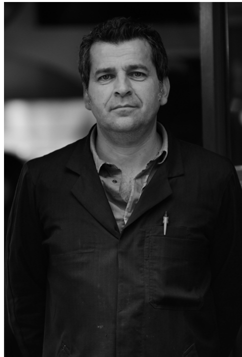
En mémoire d'ANDRÉ SAVELLI -Savelli Fromages-