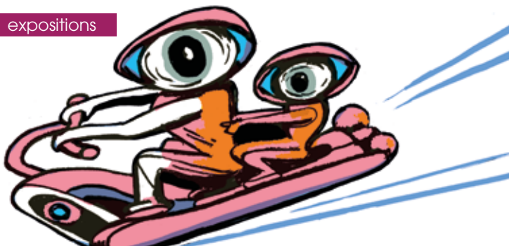
► Eyeguy © Katia Fouquet