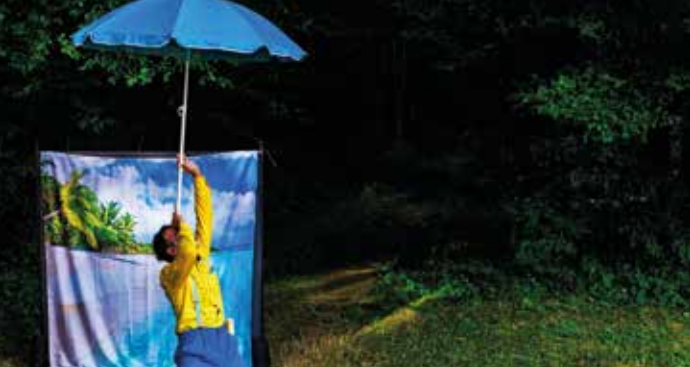
► Graines d'art

► Grand Théâtre de Provence 380 avenue Max Juvénal Renseignements : 08 20 13 20 13 - lestheatres.net