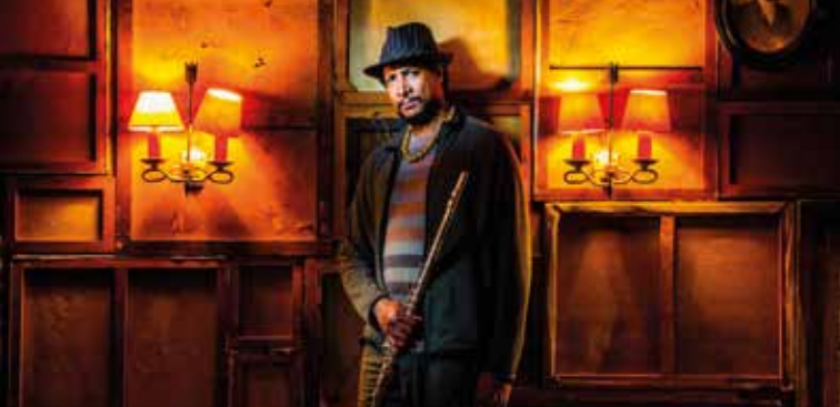
► Magic Malik

► 6MIC 160 rue Pascal Duverger Renseignements : 04 65 26 07 30 - 6mic-aix.fr