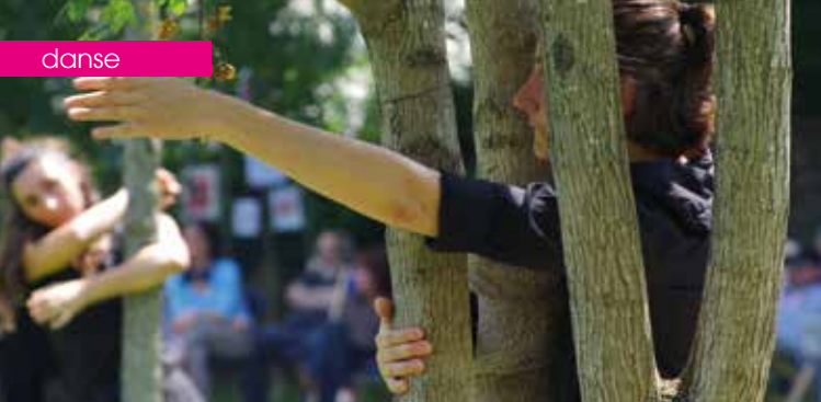
► Training danse nature © Gérard Garnier, C e Marie Hélène Desmaris