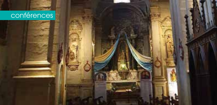
► Nef Notre Dame Esperance