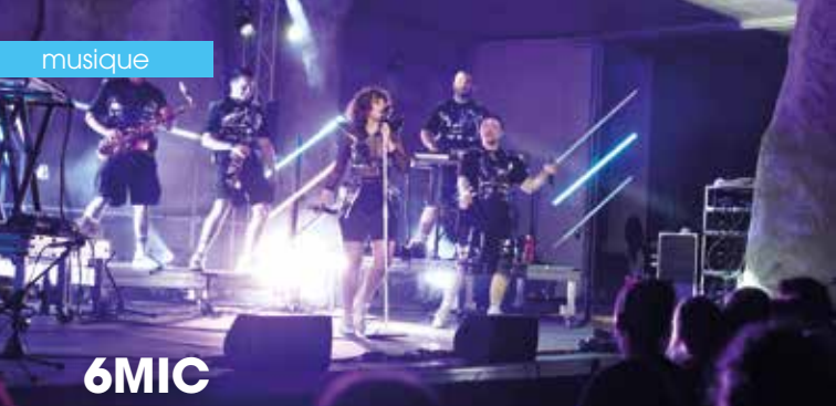
► Aix Bière Festival