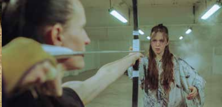
► Tela Missilia Arma © Makoto C. Okubo

mediationfondationvasarely.org - fondationvasarely.org