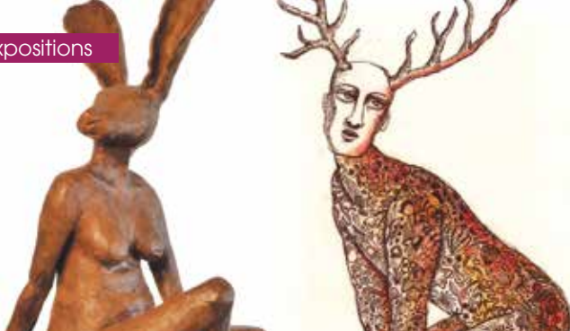
► Exposition Regard hybride