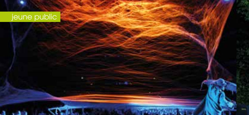
► Slava's snowshow