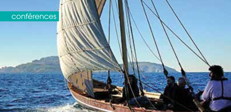
► Marseille, le monde des bateaux