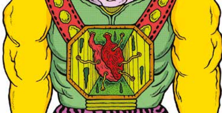
► Infernal monsters © Ben Sanair

Venez dessiner, creuser, encrez... et imprimer à la cuillère avec votre premier tampon. (8 enfants max / atelier).