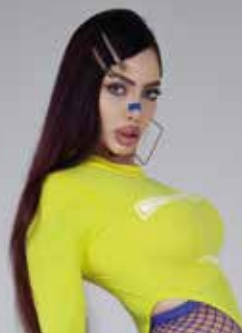
► Musica Femina , Comagatte © La Fonderie