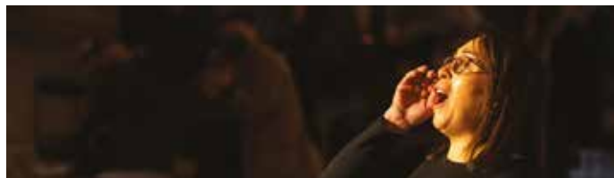
► Segen , Youyou Group