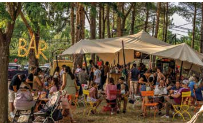
► Vendredis du CIAM