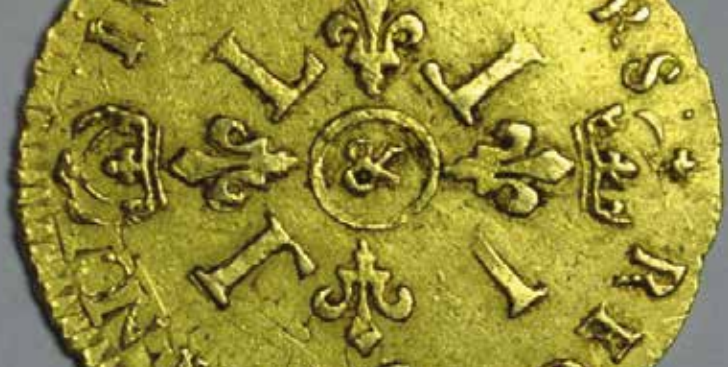
► L'Atelier Monétaire d'Aix-en-Provence

Renseignements : 04 42 27 66 47 - animation@librairiegoulard.com