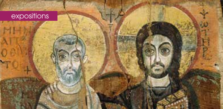
► Le Christ et Abu Mina , VI e ou VII e siècle, provenant du monastère de Baouit, Moyenne Égypte © Paris, Musée du Louvre.