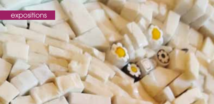
► © Mireille Martine