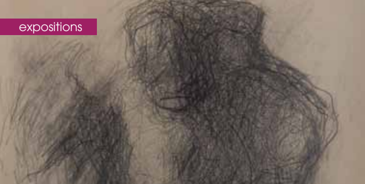
► Edmon Quinche Couple