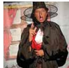
► Mamouchka l'apprentie sorcière

Elle s'apprête à passer son examen d'apprentie sorcière chez la célèbre Krokela. Pour que l'examen soit une réussite, il lui faudra inventer des formules magiques, manipuler le balai, préparer une soupe à la sorcière, lire l'avenir dans la boule de cristal... Quelques surprises vont l'attendre, notamment sa rencontre avec Gaston la chauve-souris, ou Marcel, le rat testeur des soupes à la sorcière ! Heureusement que les enfants, ses apprentis assistants, vont pouvoir l'aider dans cette épreuve !