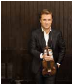
► Renaud Capuçon & Lausanne Soloists

► Le Grand Théâtre de Provence le 9 février à 20h