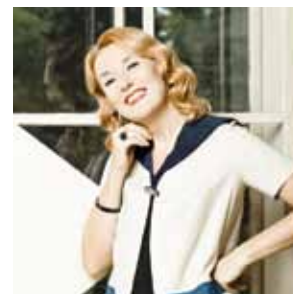
► Magdalena Kožená

Surnommée parfois la « Cecilia Bartoli tchèque », eu égard à la finesse de son timbre et la sensibilité de son jeu scénique,