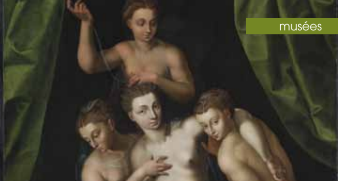
► École de Fontainebleau XVI e siècle, La Toilette de Vénus

➡ Salle Armand Lunel - Cité du Livre 8/10 rue des allumettes Renseignements : 04 42 91 99 19