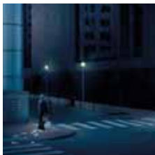
► Night Hawks © Geert de Tæye

Une sélection d'oeuvres mettant en exergue le talent de cet auteur appartenant à la nouvelle génération de photographes de mise en scène dont des artistes comme Jeff Wall ou Gregory Crewdson ont été les pionniers.