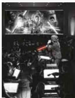
► B.O Symphoniques

L'Orchestre Symphonique du Conservatoire, sous la direction de Jean Philippe Dambreville, interprète des musiques de films au profit du dispositif : Orchestre à l'école, soutenu par 5 clubs rotary d'Aix-en-Provence.