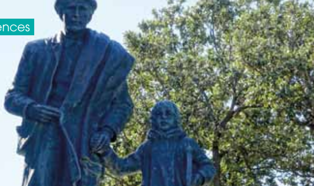
► Ruta de exili de la vajol les illes DR