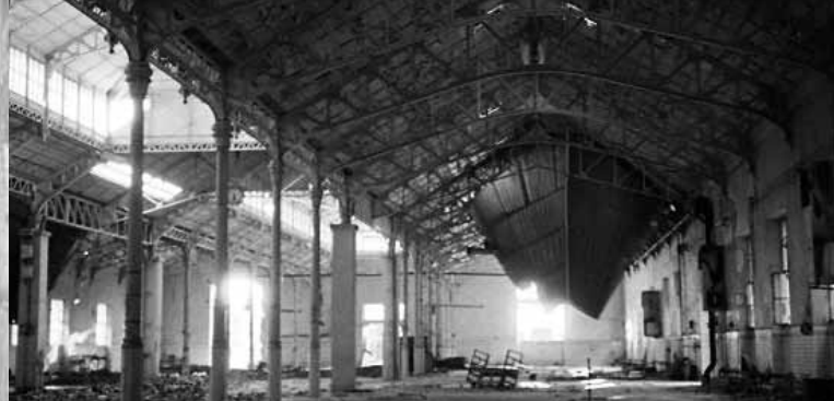
► Manufacture d'allumettes d'Aix