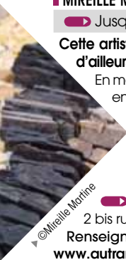
► © Mireille Martine

https://www.facebook.com/latelier.galerie