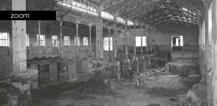
► Manufacture d'allumettes d'Aix