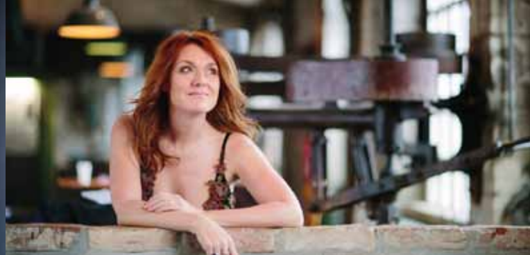
► Magdalena Kožená