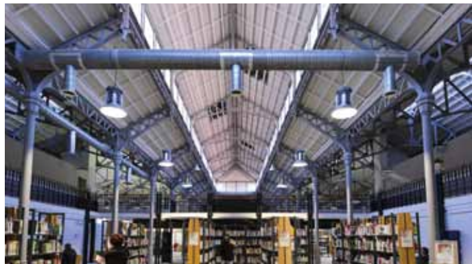
▶ © Ville d'Aix