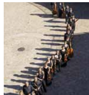
► Café Zimmermann