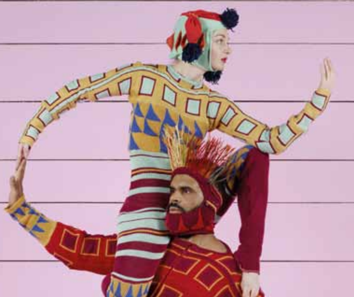
► Nouvelles pièces courtes © Charles Freger