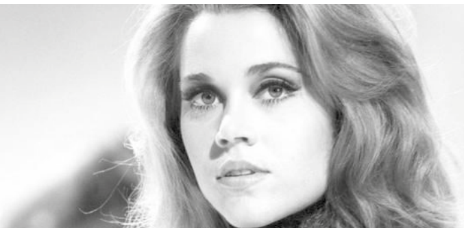
► Jane Fonda