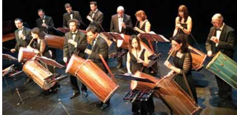
► Concert prélude aux fêtes de Noël

➔ Amphithéâtre de la Verrière - Cité du Livre 8/10 rue des Allumettes - www.festivalsunart.com