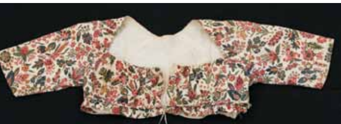
► Caraco à la spencer en cotonnade, vers 1790, Manufacture Oberkampf, Jouy en Josas

► Millepertuis, maquettes de Brendel, Coll. Université Claude Bernard, Lyon 1