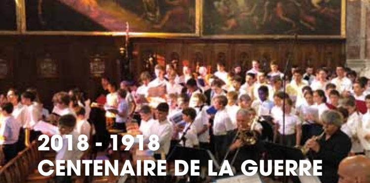
► Concert Artisans de paix DR