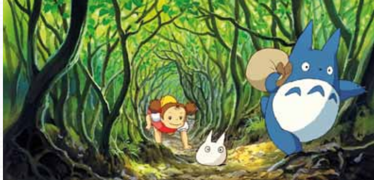
► Mon voisin totoro

► Centre franco-allemand 19 rue du Cancel Renseignements : 04 42 21 29 12 - info@cfaprovence.com