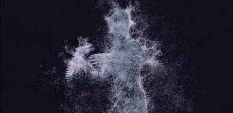
► Experiences en Suspension © Muted Christophe Monchalain