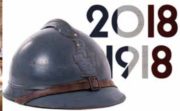
► © Gettyimage