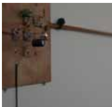
► Salle de brouillage

Avec Julien Clauss, Caroline Delieutraz, Harm van den Dorpel, eRikM, Géraud Souhliol.