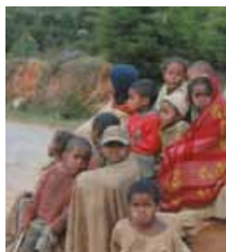
► Opération Orange

➡ Auditorium Campra le 17 novembre à 20h30