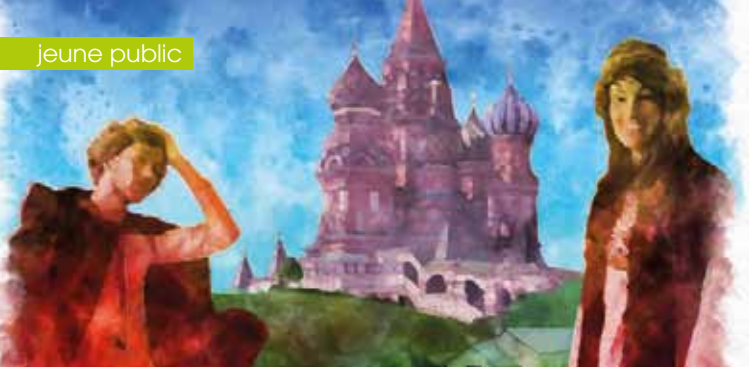
► Les trois questions