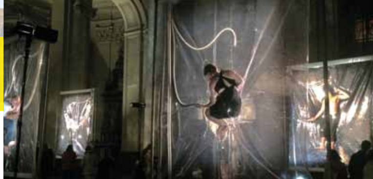
▶ Shrink © Lawrence Malstaf