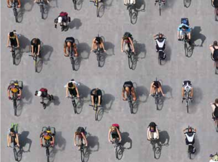
► Les cyclistes