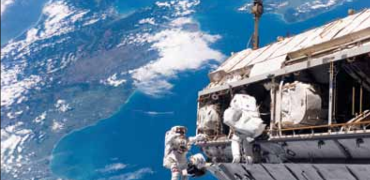
► L'homme orbital