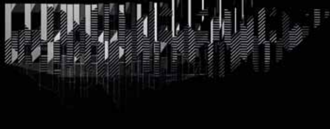
► Parallel waves © Gaspar Battha, Andras Nagy