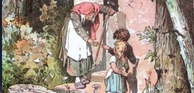
► Hansel et Gretel

Renseignements : 04 42 59 19 71 - lamareschale.com