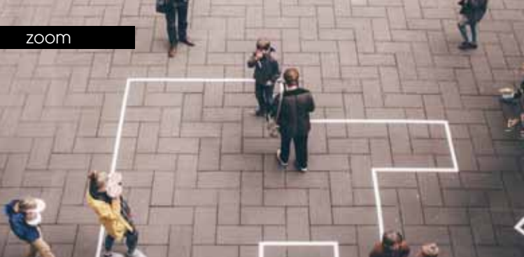
► Virtual ground