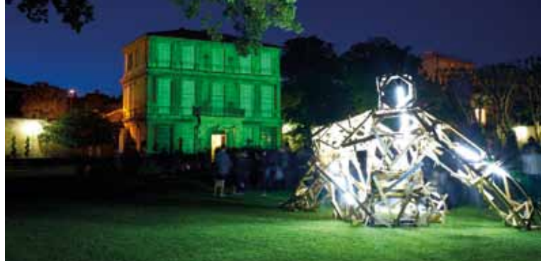
► Monumenta DR

► Musée des Tapisseries 28 pl. des Martyrs de la Résistance Renseignements : 04 42 23 09 91 animationpavillon@mairie-aixenprovence.fr