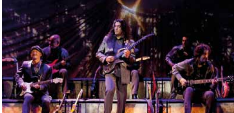
► Les theatres sinfonity DR

Renseignements : 04 88 71 84 20 aixenprovence.fr/Conservatoire