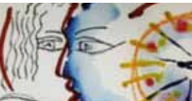
Dances des Mondes DR ◀

► Amphithéâtre de la Verrière le 20 mai à 20h30