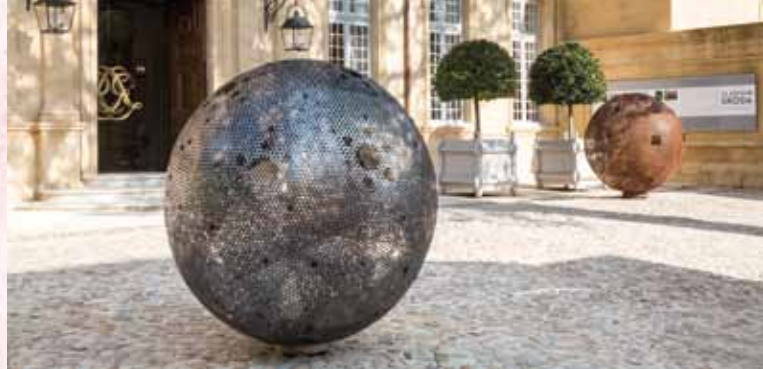
► Hotel de Caumont - V. Skoda © Culturespaces/Sophie Lloyd