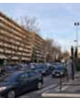
Avenue Europe DR ◀

Les origines du bruit et ses effets, les solutions techniques pour en limiter les impacts et les aides à la rénovation.