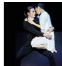
► Pavillon Noir Angelin

► Grand Théâtre de Provence 380 avenue Max Juvénal Renseignements : 08 20 13 20 13 lestheatres.net