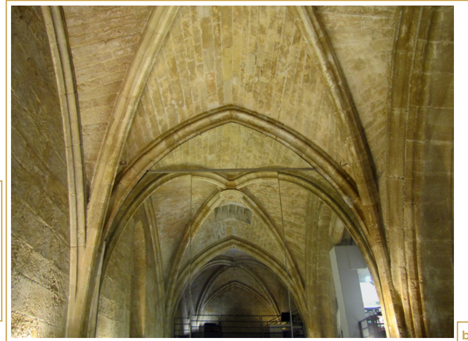
777 a et b Église des Carmes. Parties de l'église conservées dans le bâti contemporain et actuellement occupées par des commerces (passage Agard)