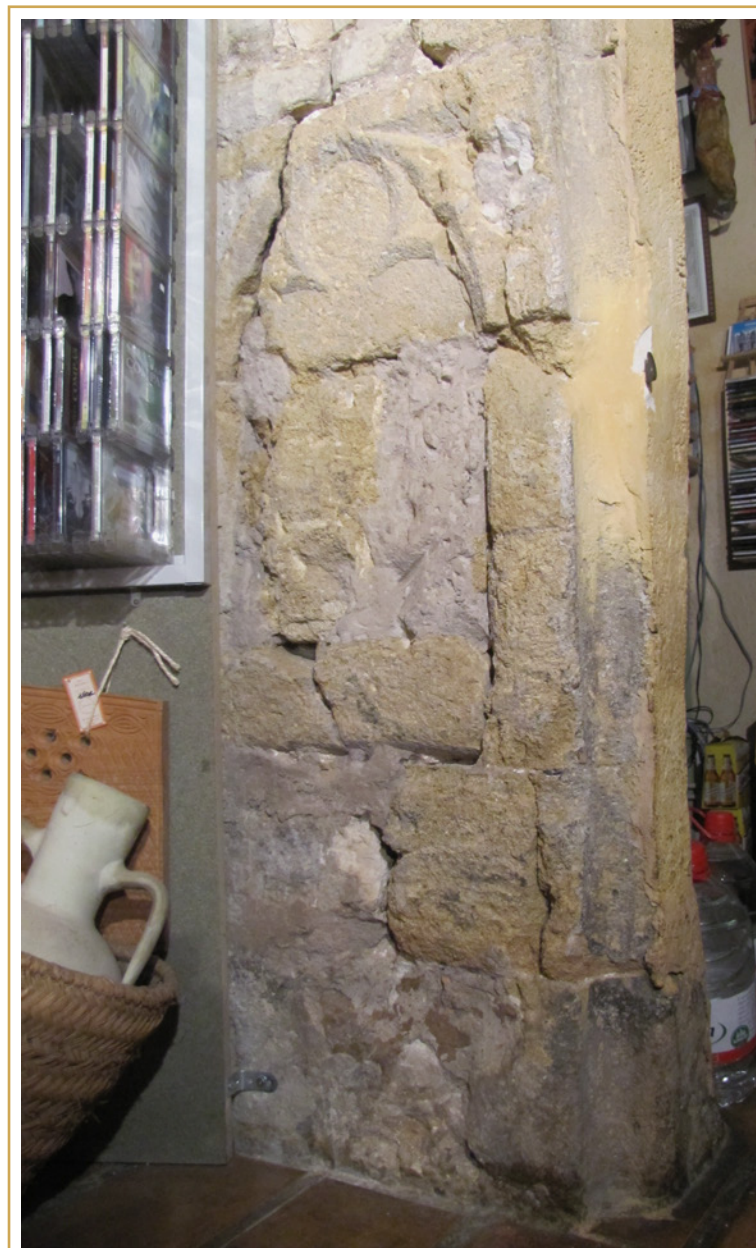
779 Troisième couvent des Dominicaines de Notre-Dame-de-Nazareth. Détail d'un bas-relief ornant le remplage l'intérieur d'un enfeu de l'église. 7 ter, rue Mignet, Maison de l'Espagne.

Extrait du cadastre napoléonien (1828). De part et d'autre d'un axe nord-sud correspondant à la clôture monastique édifiée en 1426, deux systèmes parcellaires radicalement différents trahissent l'emprise du couvent détruit à la Révolution : à l'est, jusqu'à la rue Mignet, les espaces anciennement occupés par les Dominicaines suivent une orientation rigoureusement nord-sud, tandis qu'à l'ouest, ce parcellaire s'aligne sur un axe nord-ouest/sud-est, dicté par le tracé perpendiculaire de la rue des Épinaux.