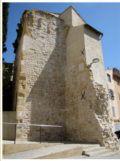
532a La tour Bellegarde et sa courtine occidentale.