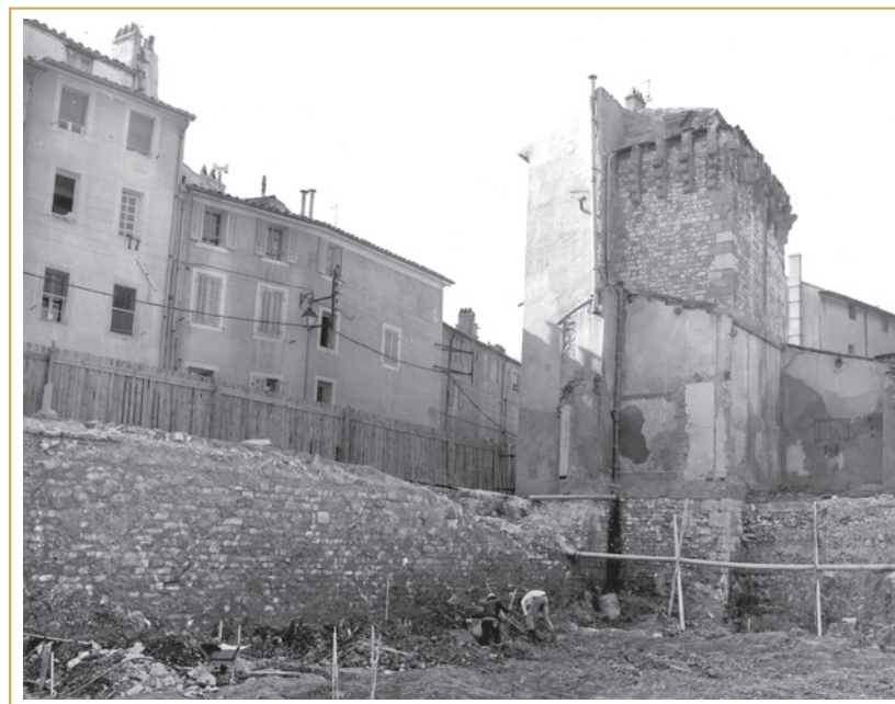
531 Vue de la tour Bellegarde et de sa courtine orientale, prise à l'occasion de travaux de terrassements du parking Bellegarde en 1975.

Au centre, la tour Bellegarde a été élevée sur un décrochement de la courtine qui a sensiblement infléchi son orientation vers l'ouest, afin d'optimiser le tir de flanquement (532). Témoignant des modes de construction en cours durant tout le Moyen Âge, ses élévations, ainsi que celles de sa courtine occidentale, sont des maçonneries fourrées aux parements appareillés de moellons équarris et liés au mortier de chaux. La pierre de taille, un calcaire coquillier du type Bibémus, y est réservée aux arêtes de l'édifice (chaînes d'angle) et à ses organes de défense (archères et mâchicoulis), tandis que des chaînages horizontaux composés d'une ou deux assises de réglages plus puissantes, assurent la cohésion de la construction (533). Dans cet ensemble homogène, la grande diversité des matériaux utilisés – calcaire lacustre, pierre froide, lauze, silex, galets de rivière, calcaire coquillier et autres molasses –, le façonnage peu soigné des moellons, l'usage de pierres gélives impropres à la construction, la présence de nombreux remplois, autant que l'irrégularité des assises et des joints ou la pose fréquente de pierres en délit, semblent bien trahir une exécution rapide.