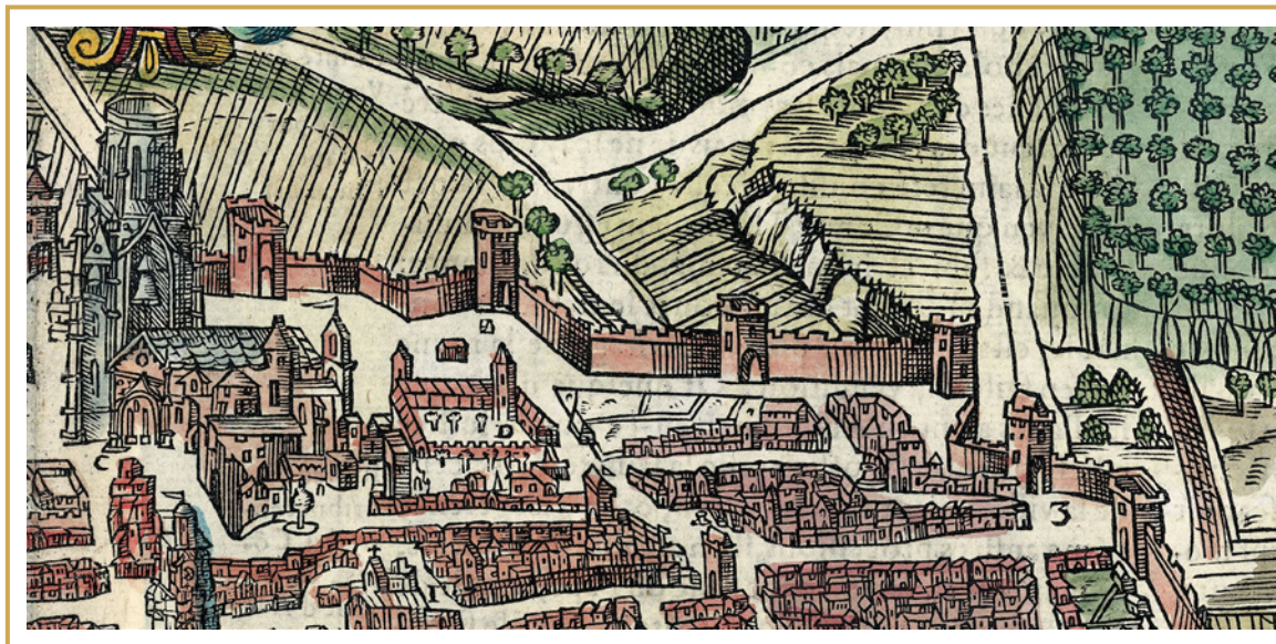
534 Rempart nord du quartier Bellegarde représenté par François de Belleforest, en 1573-1575. Le document laisse apparaître un tissu urbain encore très clairsemé aux abords de l'enceinte (collection privée).

L'équipement défensif reste, ici, comparable à celui des segments conservés le long du cours Sextius et notamment sur la Tourreluque. Deux longues archères cruciformes à étriers (1,80 m - 1,90 m), très caractéristiques des enceintes élevées au XIV e siècle, dans les États pontificaux, traversent ainsi chaque façade de la tour Bellegarde. Réparties sur deux niveaux, à l'aplomb l'une de l'autre, elles éclairent la distribution intérieure de la tour, peut-être ouverte à la gorge dans ses dispositions initiales. La présence d'une autre archère accessible depuis la base de la courtine, permet en outre d'évaluer le niveau de circulation médiéval intra-muros à moins d'1 m sous la voirie actuelle. En partie haute, une ligne de mâchicoulis sur consoles, associée à un chemin de ronde en encorbellement et probablement crénelé, complétait le dispositif défensif de la tour (534). La courtine occidentale qui, au contact de la tour Bellegarde, a conservé son élévation originelle, a, en revanche, perdu tous les aménagements de son chemin de ronde sommital bien attesté par l'iconographie (535). Doublées au nord, par un fossé défensif dont la fouille n'a pu appréhender la largeur, supérieure toutefois à 6,50 m, la courtine occidentale et probablement la tour Bellegarde étaient, à leur base, renforcées par un épais glacis maçonné. Ce fossé pouvait respectivement porter leurs élévations à plus de 9,50 m et de 14,50 m.