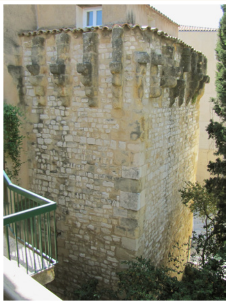
532b Élévations de la tour Bellegarde.