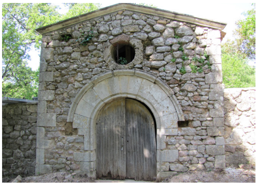
759 Façade orientale de la chapelle de Saint-Antonin.

L'aspect tardif des élévations de la chapelle interdit ainsi d'y voir l'« ecclesiam Sancti Antonini » restituée à l'abbaye de Saint-Victor en 1064. Seule sa situation de plaine, distincte du site de hauteur du Bayon, pourrait, ici, renvoyer à un maillage ecclésial antérieur au phénomène d'enchâtellement et conférer à cet édifice, moyennant une complète reconstruction, une origine beaucoup plus ancienne qu'il n'y paraît.