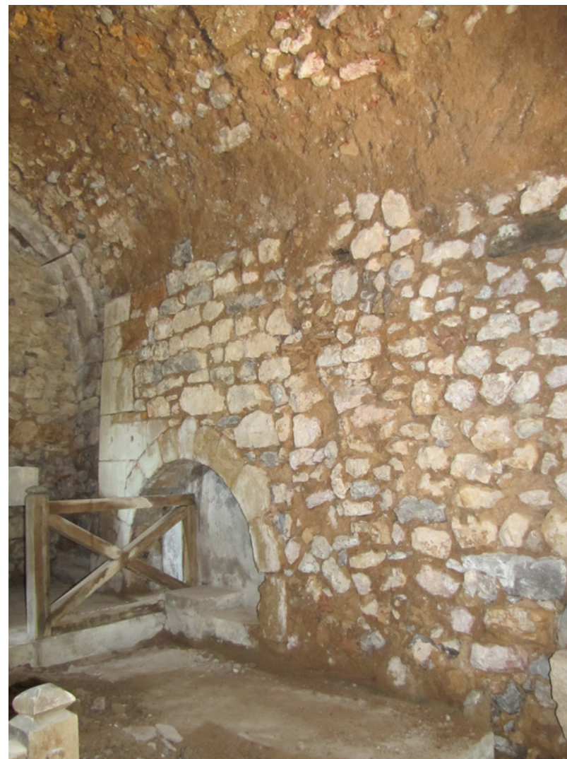
760 Vue générale intérieure depuis le sud-est de la chapelle de Saint-Antonin.