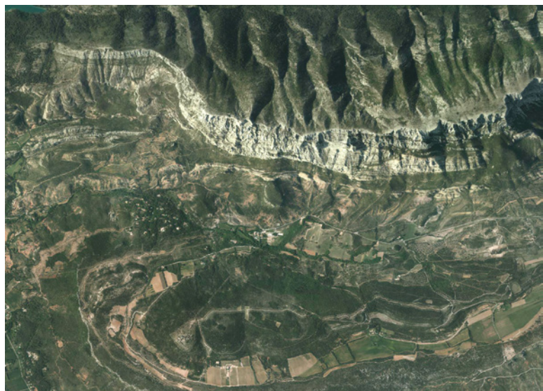
761 Ortho-photographie du site.

À l'exception d'un sol en mortier identifié au contact du mur sud-ouest, l'intervention, concentrée sur la périphérie du bâtiment, n'a pas collecté la moindre information sur sa distribution et ses aménagements intérieurs. Aucun mur de refend n'a, en particulier, été saisi au contact des maçonneries périmétrales et sans doute, doit-on envisager ici un cloisonnement à l'origine plus léger.