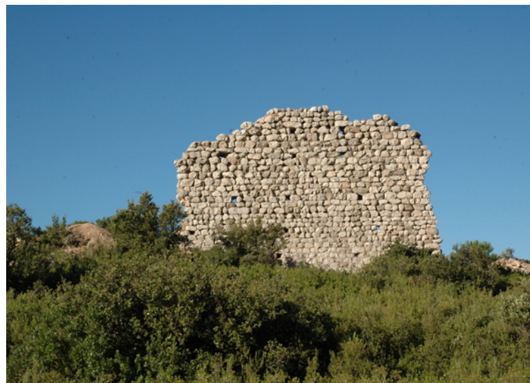
762 Vue de l'un des murs du bâtiment castral, dit « Tour de la Dent ».