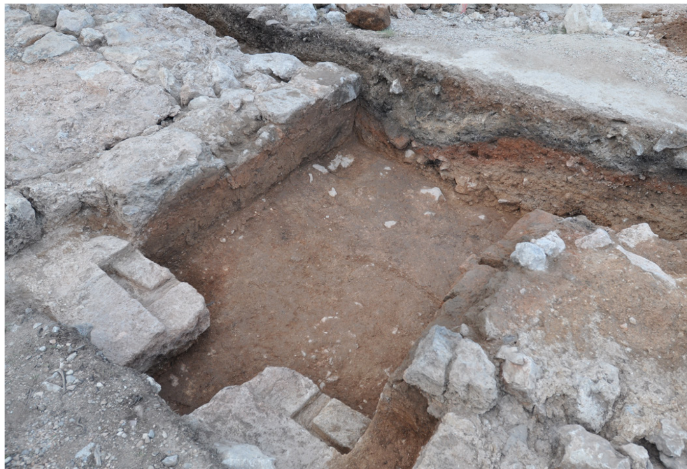
764 Vue générale de la poterne.

Ses dispositions monumentales, autant que sa situation dominante et l'empreinte volontaire qu'elle laisse dans le paysage, ne font pas de doute sur l'origine seigneuriale de la tour de la Dent encore qualifiée de « Château Vieux » au milieu XVIII e siècle (carte de Cassini). Tour-donjon quadrangulaire comme le laisse entendre la toponymie ou bien enceinte seigneuriale – l'hypothèse est étayée par la présence d'un accès de rez-de-chaussée –, cet édifice délicat à caractériser dans sa forme, l'est tout autant dans ses fonctions, faute de données matérielles. Sa désignation comme « fortalicium » en 1464 ne retient, en effet, que l'aspect fortifié de ce bâtiment qui a été le pôle organisateur d'un habitat bien attesté par les textes. Logis seigneurial, simple réduit défensif, marque d'une autorité ou encore pôle administratif pour une population villageoise dont on saisit mal aujourd'hui les cadres de vie au sein du castrum de Saint-Antonin, la tour de la Dent renvoie, quoi qu'il en soit, aux formes de la seconde vague d'enchâtellement qui se manifeste en Provence dès le milieu du XII e siècle, excluant ici tout rapprochement avec le « castrum quod nominant Baïdo » antérieur à 1064.