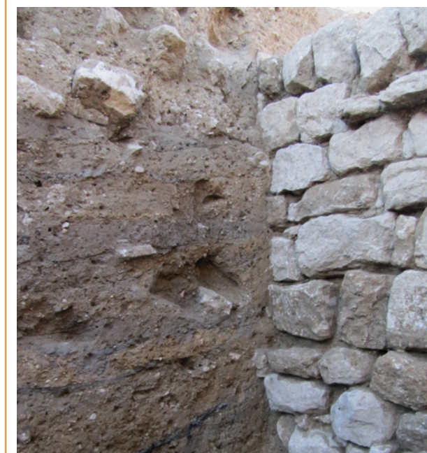
756 Liaison entre les sols cendreux et charbonneux d'une pièce et le mur qui la ferme.