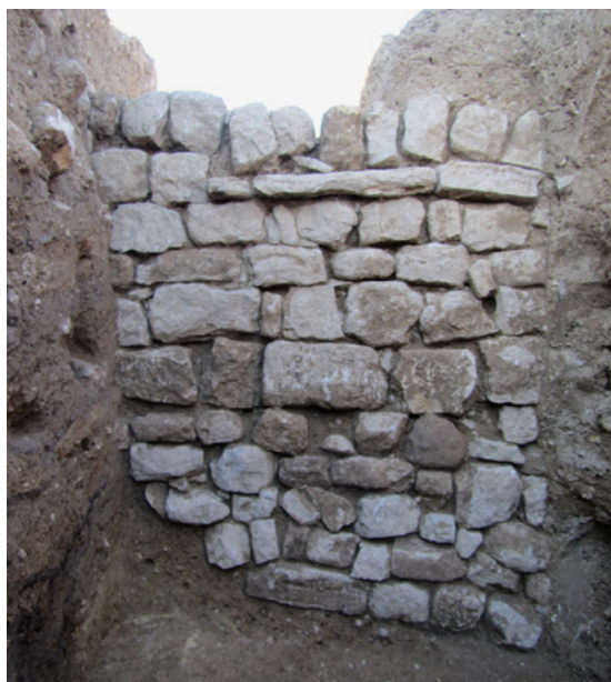
755 Murs d'habitation mis au jour lors du diagnostic.