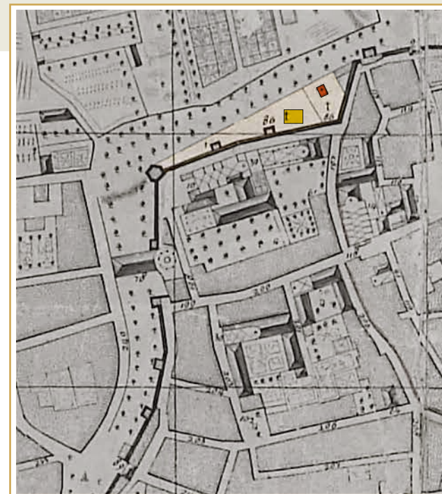
745 Extrait du plan de la ville d'Aix dressé par Esprit Devoux en 1753.

L'édifice figure sur le plan cadastral de 1828 sous le numéro de parcelle L167, enregistré comme « chapelle » propriété communale, dans l'état de section. La fouille n'a pas permis d'en appréhender les vestiges.