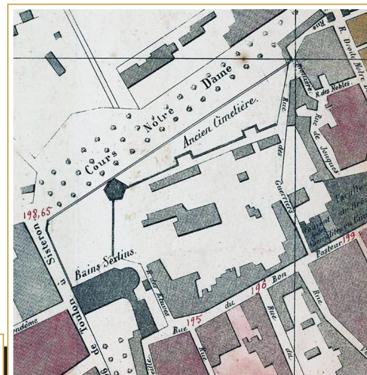
749 Extrait du plan de la ville d'Aix de 1848 (coll. privée).