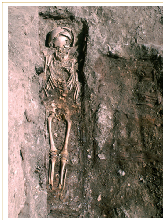
748 Vestiges du cimetière des indigents retrouvé en 1996.

En 1819, sur le plan d'alignement général de la ville d'Aix dressé par Antoine Besson, les deux cimetières ont été réunis en une seule parcelle que le cadastre napoléonien (1828) enregistre sous le numéro L166, à côté de l'ancienne chapelle des Pénitents. Dès 1848, Ambroise Thomas Roux-Alphéran sur le plan qu'il annexe à son ouvrage « Les rues d'Aix ou recherches historiques sur l'ancienne capitale de la Provence », entérine la désaffectation du cimetière auquel s'est substituée la promenade des Bains Sextius (749).