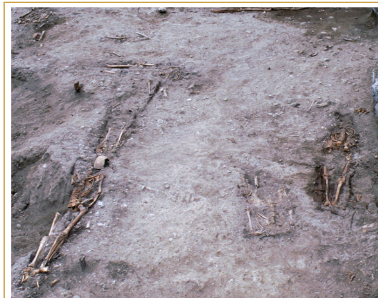
747 Vestiges du cimetière des indigents retrouvé en 1996.