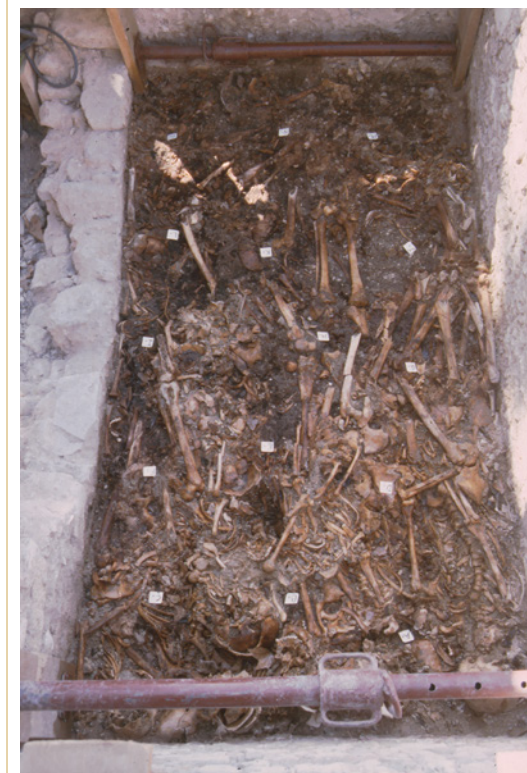
734 Caveau de la nef. Dépôt supérieur en cours de fouille, vue prise depuis l'est.