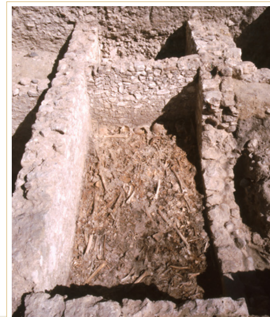
733 Caveau de la nef vu depuis l'ouest.