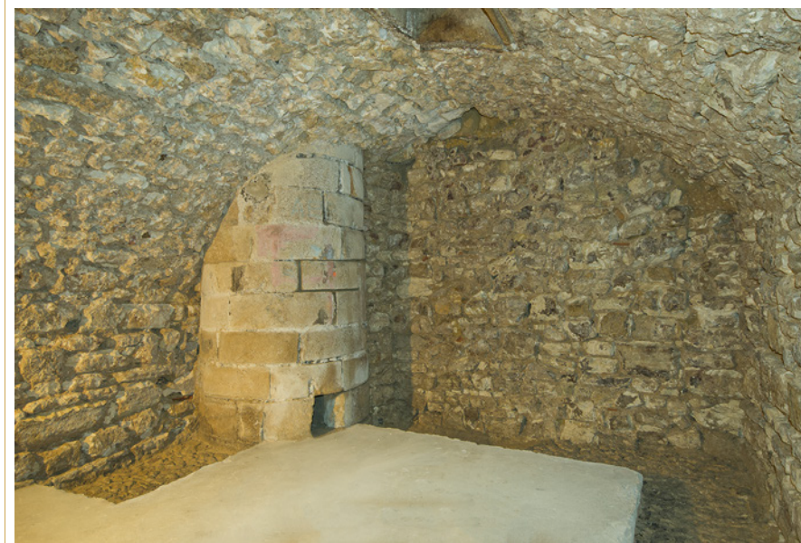
673 Vue de la gaine d'un puits public aménagée dans la cave du 8, rue Littera.