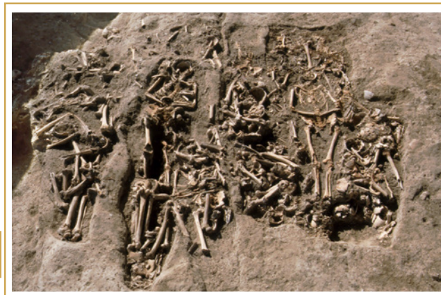
731 Cimetière du parvis. Vue d'un ensemble de sépultures devant le porche de l'église.

Quatre lieux très inégalement documentés par la fouille et par les textes, ont accueilli les dépouilles des fidèles et des moines : le cimetière du parvis, l'église, le cloître et la salle capitulaire.