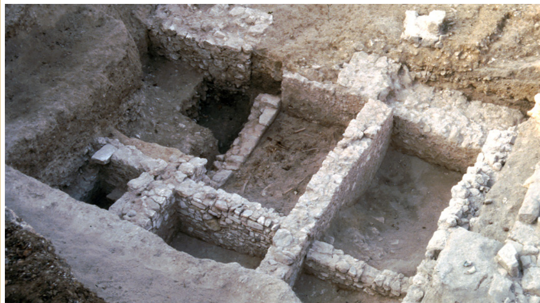
732 Première travée de la nef édifiée en 1561 en cours de fouille, vue plongeante prise depuis le nord-est. Six caveaux témoignent du lotissement funéraire dont le sous-sol a fait l'objet.

À côté de ces ensembles spécifiques et réservés, la nef semble avoir fait l'objet d'un véritable lotissement en sous-sol pour l'accueil massif de sépultures. La fouille de sa première travée a ainsi mis en évidence un compartimentage régulier et systématique en caveaux d'environ 2,40 m sur 1,30 m dans-oeuvre, dont le découpage raisonné, nécessairement encadré par les Observantins, éclaire le modèle économique des ordres mendiants (732) : intercesseur auprès de Dieu par ses prières pour le repos des âmes des défunts, la communauté a ici manifestement cherché à optimiser les revenus que lui procurent l'accueil des morts et l'encadrement du passage vers l'au-delà. La gestion de ces structures funéraires est illustrée par la fouille de l'un des caveaux qui a livré quarante-neuf individus ou fragments d'individus en connexion, ainsi que de très nombreux os épars, répartis sur cinq niveaux (733). L'étude anthropologique a porté sur les trois niveaux les plus récents, soit vingt-cinq individus en connexion anatomique, auxquels ont été ajoutés quarante et un sujets documentés par des os épars.