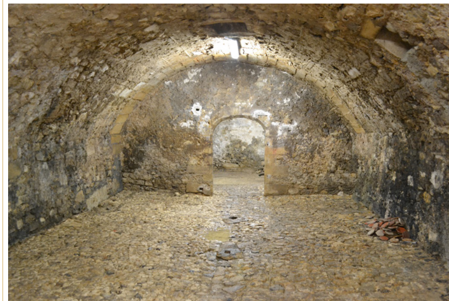
672 Vue d'une cave et de sa voûte en berceau surbaissée de l'Hôtel d'Oraison.

Au XIXe s, de nouveaux modes de vie affectent la maison. Les modifications touchent la pièce du rez-de-chaussée qui devient, comme les étages, un lieu de vie et non plus seulement, un espace domestique, commercial ou artisanal. La cave se transforme elle aussi peu à peu ; auparavant exclusivement réservé au stockage, son usage évolue vers une plus grande polyvalence et accueille des fonctions antérieures du rez-de-chaussée. Outre le stockage des liquides pour les marchands de vin et les débits de boisson, les observations faites dans le cadre d'un programme de prospection, ont ainsi bien mis en évidence ces évolutions : au 6, rue Peyresc a été relevé un fournil de boulanger avec le four à pain et le puits attenant, mais également des espaces de travail pour du petit artisanat, des espaces de lavage du linge avec des aménagements dans le sol pour l'évacuation d'eaux sales. Quant aux sous-sols de l'hôtel de Gras, au 3, place des Prêcheurs, ils sont formés par un long couloir parallèle à la place des Prêcheurs, donnant accès, de part et d'autre, à cinq cellules, dont certaines ont été utilisées comme cuisines.