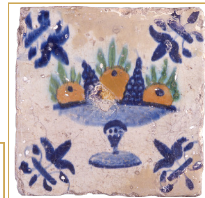
699 Carreau hollandais polychrome, bourg Saint-Sauveur, XVIIe s., coll. part.