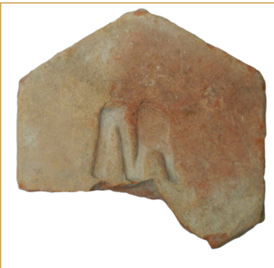
704 Marque quadrilobée et marque aux initiales MR au revers d'une tomette, fouille de la rue de Littera, fin XVIIIe s.

S'il est couramment admis que la tuile canal ronde remplace la tegula antique plate, au cours du Moyen Âge, les premières tuiles plates cloutées sont mentionnées en 1412 à Aix, pour la couverture de l'église des Carmes. À la mode des grands combles à la française, sous l'Ancien Régime, est lié l'emploi de tuiles vernissées sur les bâtiments de pouvoir. Ainsi à Aix, dès 1559, ces tuiles colorées sont fixées sur la toiture du palais Comtal à l'aide de clous ou d'un crochet assurant leur fixation. D'autres édifices s'en parent tel le dôme du Baptistère Saint-Sauveur en 1577. Cette mode se prolonge tout au long du XVIIIe et du XIXe siècle, et le registre du Livre de bâtisse de l'hôtel de Caumont, pour l'année 1741, enregistre un achat de 1 700 tuiles vernissées pour couvrir la terrasse. Pendant la période révolutionnaire, le Monument dit de Joseph Sec comporte encore une toiture en semis coloré. Les restaurations récentes en ont gardé le souvenir mais peu d'artefacts anciens nous sont parvenus dans les fouilles de l'ancien Office de Tourisme sur la Place de la Rotonde.