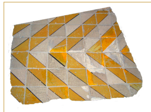
698 Sol de carreaux catalans, hôtel particulier, place Albertas, XVIIe s.