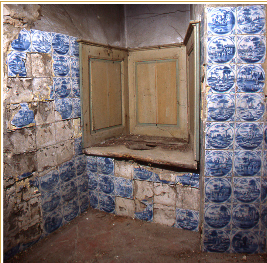
700 Cabinet d'aisance des hôtels Deux-Brézé et Lauris-Arlatan, carreaux hollandais, XVIIIe s.