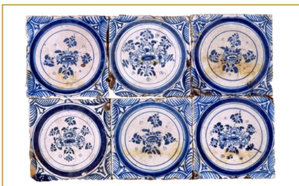
703 Carreaux de Saint-Jean-du-Désert, bourg Saint-Sauveur, XVIIIe s., coll. part.