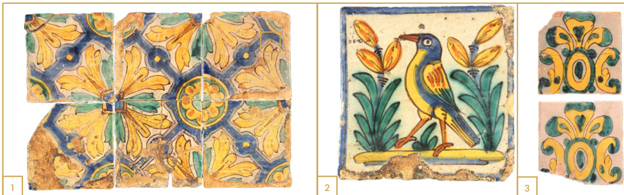
697 N° 1 : Ensemble de carreaux catalans, couvent des Oblats ; n° 2 : carreau à l'oiseau dans un cadre bleu, couvent des Oblats ; n° 3 : carreaux catalans, Fouille de l'Archevêché. XVIIe s.