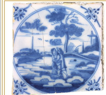
701 Scène galante sur un carreau hollandais du cabinet d'aisance, XVIIIe s.