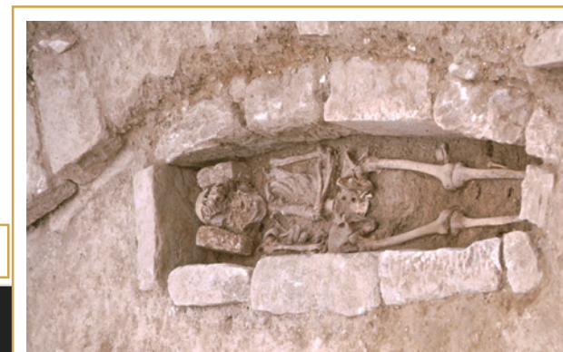
742 La Closeraie. Détail du coffrage d'une sépulture. Le défunt est encore en place.