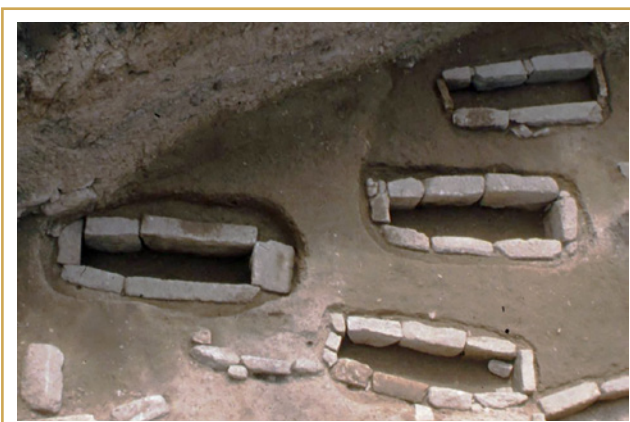
741 La Closeraie. Vue aérienne du cimetière médiéval. Les tombes ont été fouillées et on voit bien ici leur coffrage.