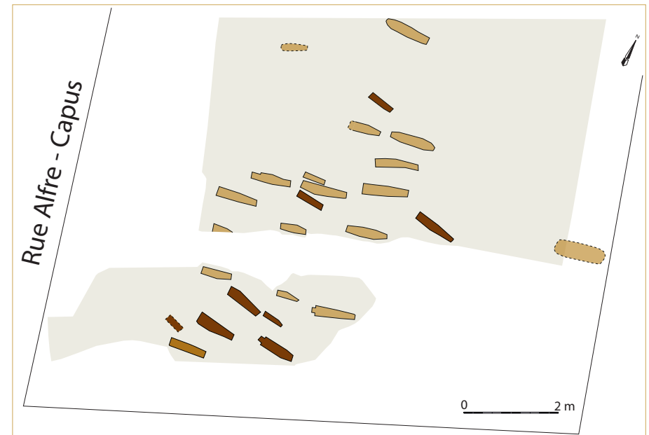
743 La Closeraie. Plan synthétique des sépultures médiévales, distinguant les deux états du cimetière.

Étroitement lié à la ville des Tours dont il dessert la population, ce cimetière est désaffecté après 1429, dans les années qui suivent l'abandon de l'agglomération et celui de l'église Saint-Laurent, détruite avant 1392.