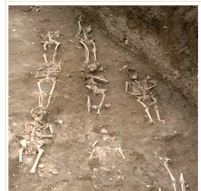
744 A. Capus. Vue générale du cimetière de pestiférés..

Ces installations sont sans doute parmi les dernières pratiquées dans le secteur, avant que le cimetière ne soit définitivement désaffecté au milieu du XVIII e siècle.