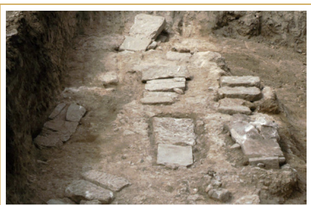
740 La Closeraie. Vue aérienne du cimetière médiéval. Les tombes sont ici encore fermées.