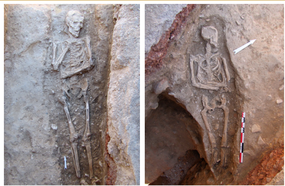
626 Sépulture découverte sous le parvis de l'église.