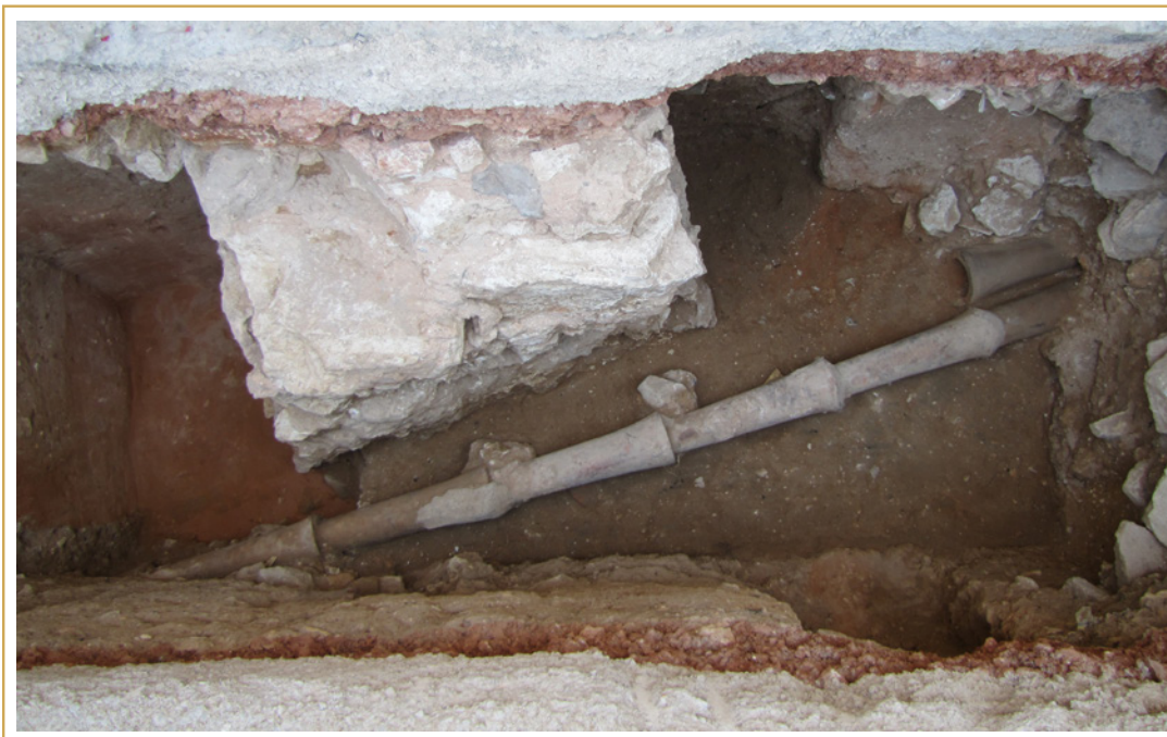
624 Vestiges de la maçonnerie du chœur primitif.

Les limites de cet espace funéraire ne sont bien appréhendées que pour cette période, durant laquelle elles sont matérialisées, au nord et à l'est, par deux murs de clôture mis au jour lors des recherches.