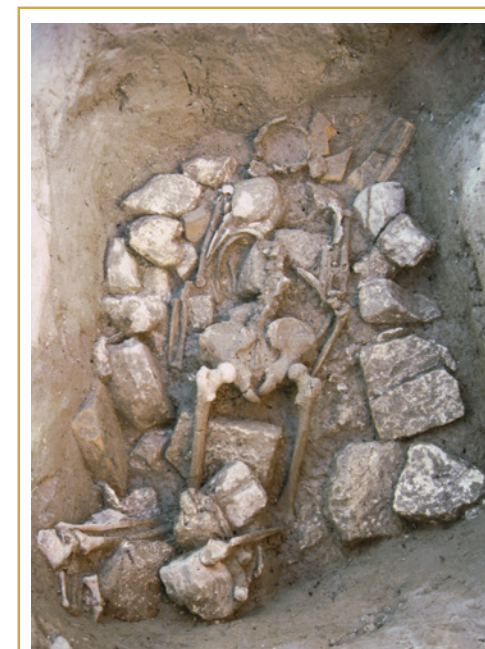
489 Individu jeté face contre terre dans une fosse profonde et trop courte pour recevoir son corps.