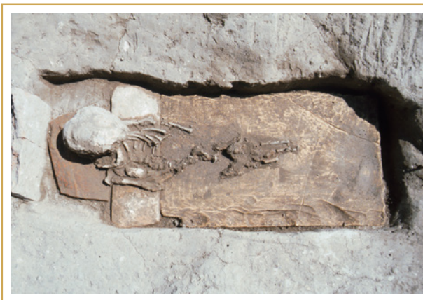
486 Inhumation d'enfant en coffrage de tuiles.

Ressort des quelques sépultures mises au jour, l'impression d'une fréquentation sporadique du site, qui n'aura pas de développement durable, sans doute en raison de son éloignement par rapport aux nouveaux noyaux d'occupation urbains, désormais fixés beaucoup plus au nord. Par ailleurs, rien dans les pratiques funéraires ne trahit de manifestation de la foi chrétienne.