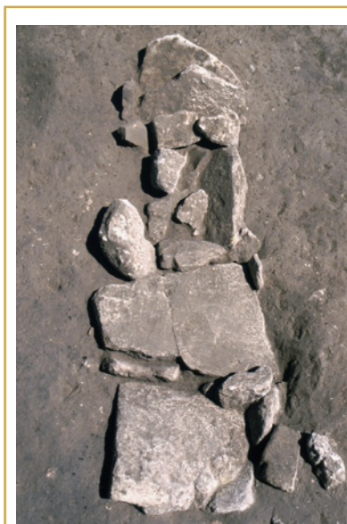
488 Inhumation en pleine terre avec sa couverture de lauzes calcaire.