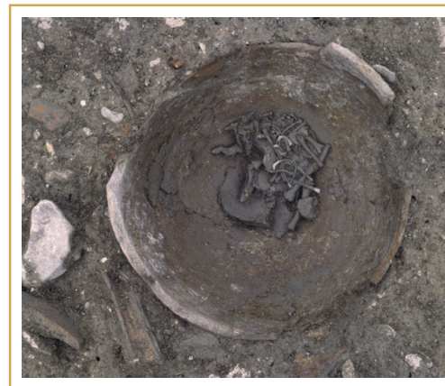
487 Inhumation en amphore d'enfant mort en période périnatale.