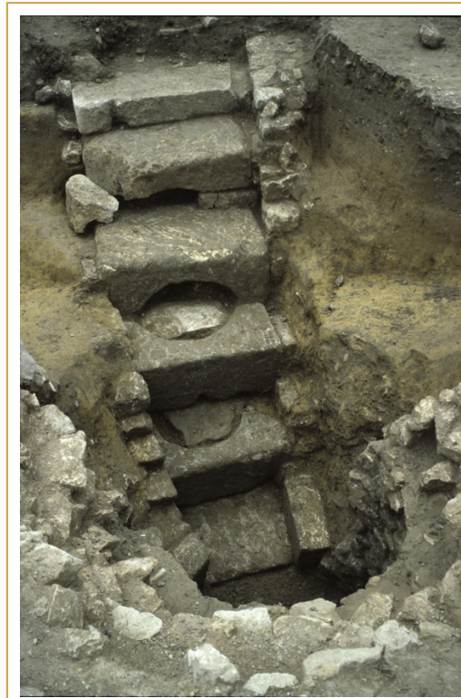
480 Puits construit au cours de l'antiquité tardive. Doté d'un escalier d'accès, construits avec des blocs en réemploi provenant très certainement d'un édifice public. Parking Signoret 1991

En dépit de leur caractère modeste, les vestiges repérés aux abords de l'aire urbanisée dans les premiers temps de l'Antiquité tardive, rendent compte d'une fréquentation encore très active, que celle-ci soit en lien avec des travaux de construction ou avec la mise en culture des terres.