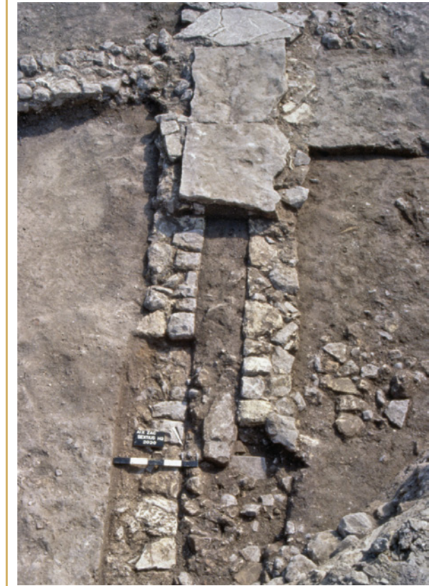
479 Égout aménagé extra-muros, au sud de la ville.