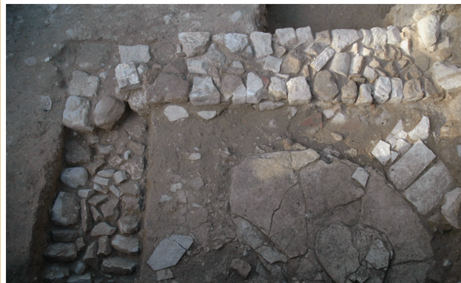
477 Bâtiment sud.

Tandis que les fossés associés à la voie Aurélienne sont colmatés au début de l'Antiquité tardive, tant au 1, de la route de Galice qu'au 8, rue des Bœufs, se font jour des aménagements qui s'inscrivent dans la continuité des dispositifs de drainage du Haut-Empire. Consistant en petits fossés et drains empierrés, orientés nord-est/sud-ouest, ils ne paraissent pas liés à la route, comme l'étaient les fossés antérieurs. Leur pendage vers le sud-ouest indique qu'ils évacuaient les eaux sales de la ville, alors rejetées dans cette zone basse de façon, semble-t-il, informelle. Le mobilier recueilli dans leur remplissage, place leur utilisation au Ve siècle.