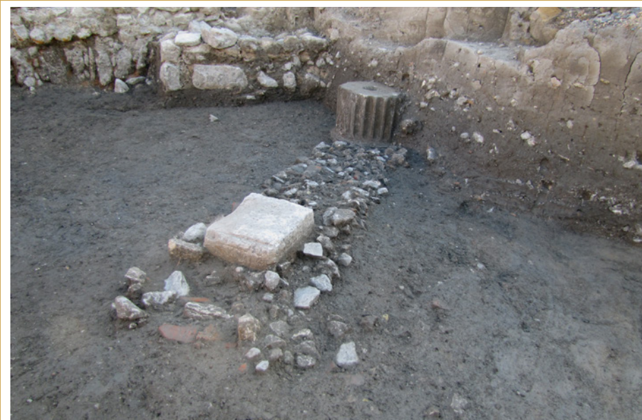
478 Mur d'un bâtiment établi au sud de la voie Aurélienne.