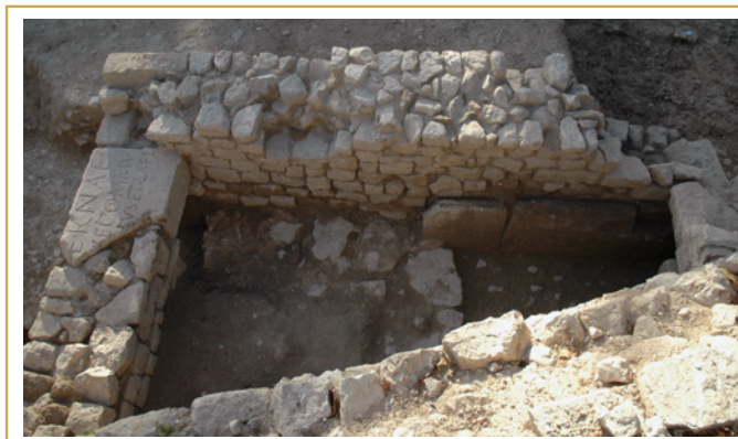
475 Bâtiment le plus septentrional, construit contre la courtine, vu du sud.

Au nord de la via Aurelia, la voie périphérique est ainsi, depuis quelques temps déjà, colonisée par des petites constructions qui en réduisent l'emprise. On en compte au moins trois, appuyées à la fortification, tout près de la porte d'Arles (474). Leur construction semble s'être échelonnée dans le temps. Édifié à quelque 20 m de la porte et d'une superficie dans-œuvre trop réduite pour de l'habitat (7 m 2 ), le premier bâtiment pourrait avoir eu un lien avec la muraille (475). Il affecte, en effet, la forme d'une petite tour sans présenter toutefois la puissante nécessité à un ouvrage défensif. Dans les maçonneries de ses murs perpendiculaires à la courtine, a été réservé le passage d'une canalisation destinée à drainer les eaux de ruissellement charriées par la voie, ici en forte pente (476). Si ce petit édicule était occupé, il faut donc y restituer un plancher surélevé, car toute circulation dans sa partie inférieure, au contact de la chaussée de la voie, était impossible par temps de pluie.