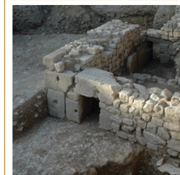
476 Châtepeleurs ménagés dans les maçonneries nord et sud de l'édicule construit contre l'enceinte, pour laisser le passage à une conduite, ici démantelée. Au premier plan, on devine le mur d'une deuxième construction également appuyée contre la fortification.