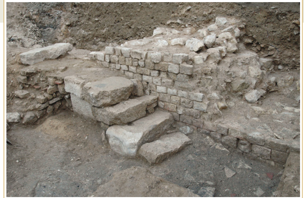
464 Escalier aménagé contre le parement externe de l'enceinte, à l'aide de matériaux en réemploi.

Dans quel état de conservation se trouvait cette muraille ? Sur cette question, l'archéologie reste muette. Peut-être était-elle déjà passablement délabrée, voire détruite sur certains de ses tronçons, mais, dans ce quartier du moins, elle semble être restée suffisamment en élévation pour toujours marquer la séparation entre extérieur et intérieur de l'espace urbain, même si celui-ci est alors largement défilé.