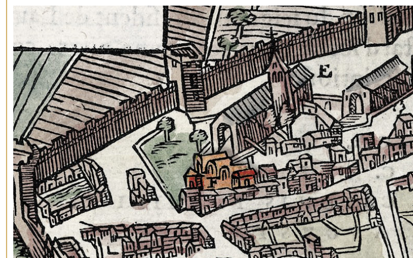
459 Détail du plan de la ville dressé par Belleforest, montrant les étuves de la fin du Moyen Âge.