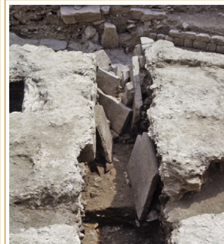
463 Egout du Haut-Empire démantelé. Ses dalles de couvertures ont été soigneusement disposées debout dans le canal du collecteur, sans doute dans l'attente d'un nouvel usage.