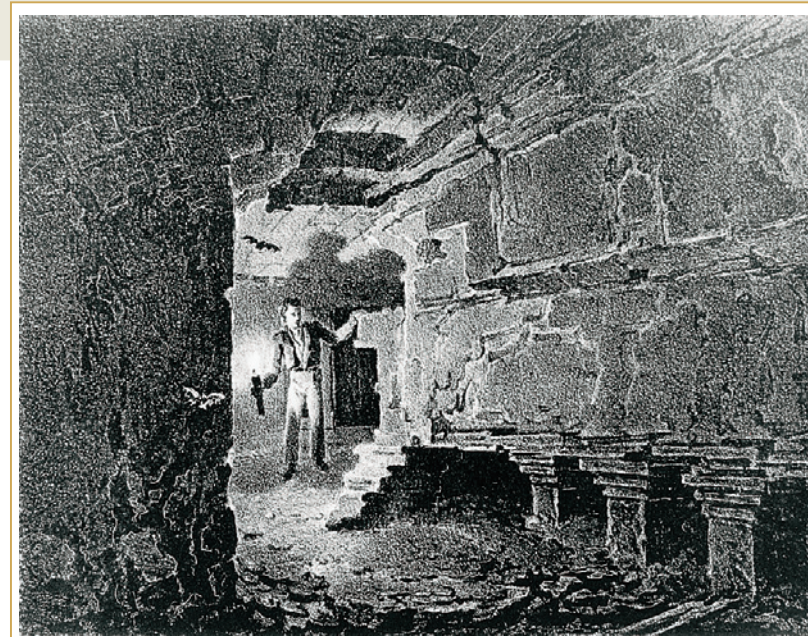
402 Dessin représentant les thermes antiques tels qu'ils étaient visibles (ou imaginés) au XIXe siècle.