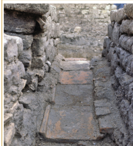
462 Un égout domestique du Haut-Empire toujours en fonction durant l'Antiquité tardive. Sa base a été refaite à l'aide de tuiles plates (tegulae).