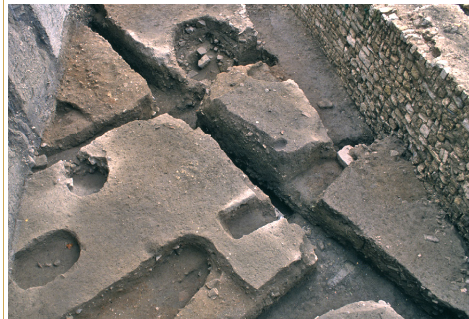
461 Vestiges des maisons tardo-antiques mises au jour sur le site des Thermes Sextius, en 1993. Les maçonneries de leurs murs ont toutes été récupérées.

En dépit des importantes modifications qui affectent alors ce quartier en cours de déstructuration, le paysage urbain que restituent les vestiges apparaît malgré tout très vivant. À côté d'édifices ayant peu ou prou conservé leur aspect d'origine, devaient s'en élever de nouveaux, construits avec des matériaux hétéroclites, récupérés au gré des opportunités offertes par le démantèlement des bâtiments délaissés. Moins bien gérée, mais toujours fréquentée, la voirie offrait sans doute un confort moindre à la circulation, rendue difficile par les travaux de récupération et les béances qu'ils créaient dans les sols, à certains moments. Mais, la nature ayant horreur du vide, comme chacun sait, chaque trou était rapidement comblé par tout ce dont les habitants n'avaient plus besoin et rejetaient : vaisselle, décombres, déchets de fabrication ou domestiques. L'accumulation des dépotoirs est, en effet, une caractéristique de cette période durant laquelle, contrairement à la précédente, les détritiques ne font plus l'objet d'une gestion raisonnée et ne sont plus évacués à l'extérieur de la ville. On les dépose où l'on peut.