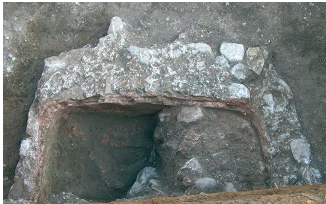
483 La cuve enduite de béton hydraulique.

À l'issue de l'expertise, rien n'assure que cet ensemble ait évolué en lieu de culte chrétien, mais rien ne l'infirme non plus. En revanche, le site n'a livré ni mobilier ni structure évoquant la présence de thermes, tout comme aucun élément architectural relevant de la partie noble d'une villa n'a été repéré.