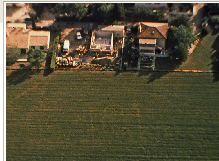
481 Vue des bâtiments enfouis, en 1964.

Recouvrant une grande partie des éléments repérés en 1964, les vestiges mis au jour, en 2006, se répartissent sur une surface d'environ 450 m 2 et laissent voir non seulement une organisation plus complexe qu'on le pensait, mais aussi une durée d'occupation marquée par au moins deux périodes correspondant, pour la première, à l'installation de l'établissement à la fin de l'Antiquité et, pour la seconde, à une occupation funéraire du Moyen Âge.