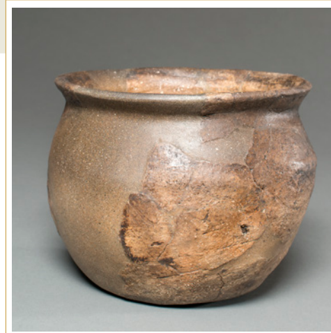
218 Urne modelée.

Le mobilier céramique recueilli dans ce fossé en rive sud de ce decumanus, témoigne bien de l'occupation du quartier à l'époque augustéenne, période rarement reconnue à Aix-en-Provence (218 et 219). Il réunit des vases de tradition indigène protohistorique régionaux (pots ou jattes modelées : 218 et n° 1 de la figure 219) ou issus d'ateliers de la vallée du Rhône (rare vase à décor peint produit à Roanne : n° 2 de la figure 219), mais aussi des produits importés d'autres provinces méditerranéennes : gobelets décorés et amphores transportant des sauces de poissons venus d'Espagne, plats à frire italiques, attestant un mode de vie « à la romaine ». On trouve aussi dans le lot des copies locales de certains de ces vases (coupes de tradition italique : n° 3 et 4 de la figure 219).