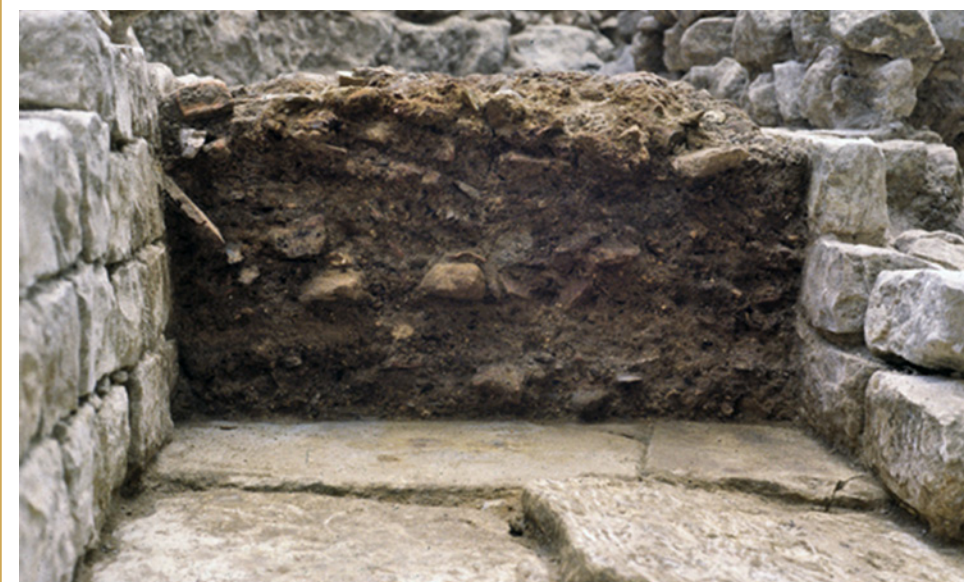
216 Collecteur public en cours de colmatage, faute d'entretien