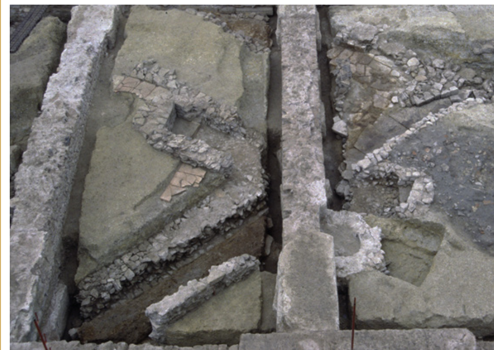
215 Puitsard construit pour permettre de raccorder l'égout du decumanus à celui méridional du cardo

À quelques mètres de l'entrée de ville, se dessine ainsi un secteur urbain où la voirie a revêtu très tôt un caractère monumental tant par ses dimensions que par ses aménagements (dallage, portiques). Bien visible, la cour à cavaedium qui encadrait la porte d'Italie devait en outre opposer un décor majestueux pour qui venait du nord de la ville. Ce cadre urbain assez remarquable, accueillait boutiques, échoppes et sans doute aussi des petits ateliers artisanaux offrant une ambiance très animée, en adéquation avec la proximité de la porte, lieu de transit des hommes et des marchandises.