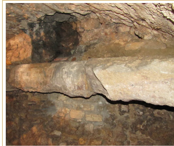
209 Dalles du decumanus maximus piégées dans la maçonnerie du mur d'une cave de la rue du Bon-Pasteur.