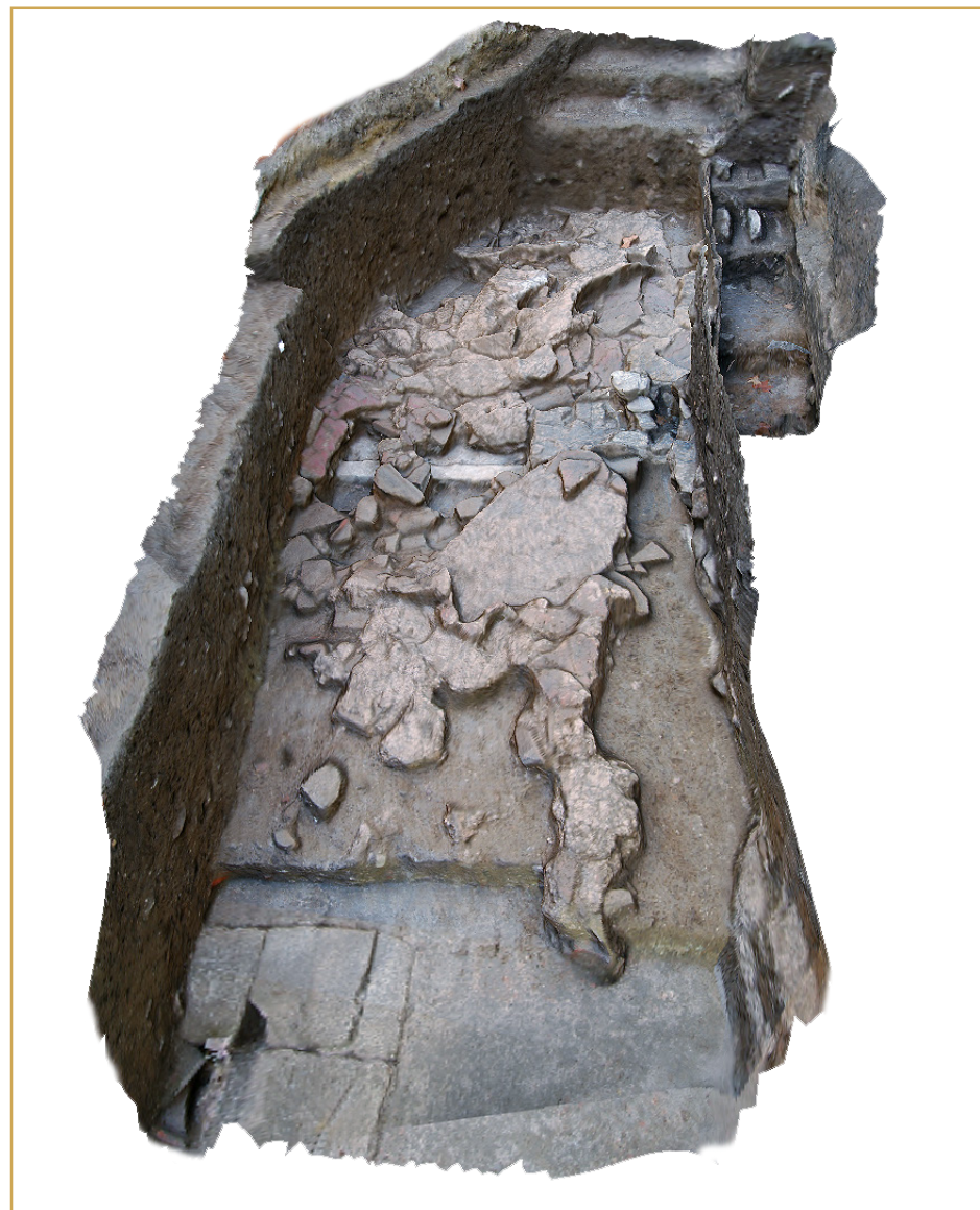
211 Habitation antique établie sur le tracé du decumanus maximus, au 1, avenue De-Lattre-de-Tassigny

Mais autant l'annexion de l'espace public par des rues secondaires, bien que normalement interdite, pouvait ne pas avoir d'incidence majeure sur le trafic, autant celle d'une voie principale soulève ici la question de la place que celle-ci occupait dans la desserte urbaine et donc celle de son statut.