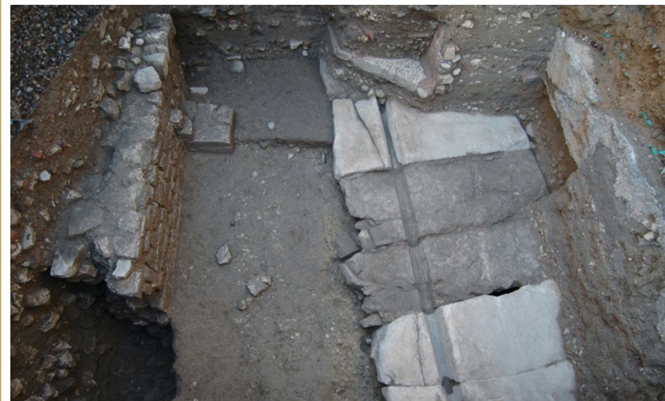
208 Le decumanus maximus vu depuis l'est, avec sa chaussée dallée à droite et son trottoir à gauche (ici dans un état antérieur).

La restitution du decumanus maximus dans la rue du Bon-Pasteur a longtemps reposé sur le tracé rectiligne de cette dernière. En 2010, cette voie antique a, enfin, été repérée lors d'une visite de cave, dans l'immeuble sis au n° 5 de la rue actuelle. Piégées dans les maçonneries modernes du mur riverain, sept dalles en calcaire froid dessinent un alignement discontinu, mais presque parfait, qui définit la limite nord de la chaussée de la voie (209 et 210). Situées en partie haute du mur et en saillie de plusieurs dizaines de centimètres, elles suivent un pendage est/ouest de 7,8 % correspondant à celui de la rue actuelle (7,1 %).