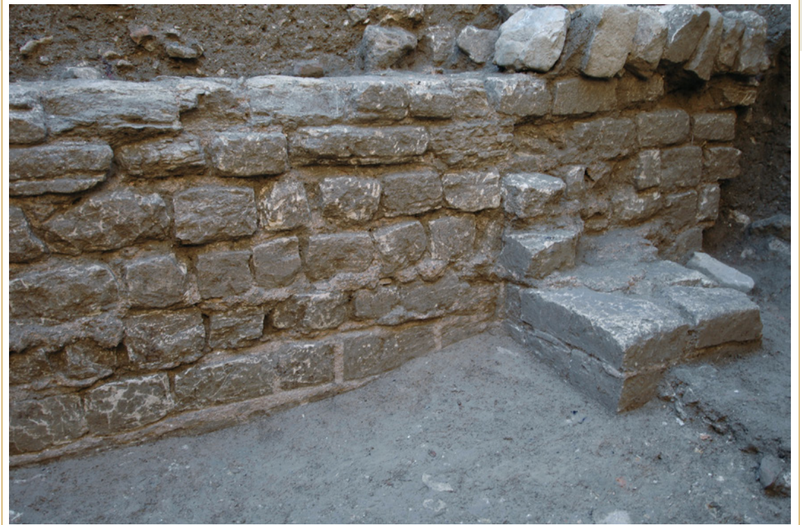
207 Mur de façade ouest du decumanus maximus vu en 2009.

Autant le tracé du cardo a été observé à intervalles assez réguliers, autant celui du decumanus reste à bien des égards énigmatique. Comme on va le voir, plusieurs découvertes récentes ont, paradoxalement, confirmé des observations anciennes, précisé sa trajectoire au nord et remis en cause la continuité de son tracé.