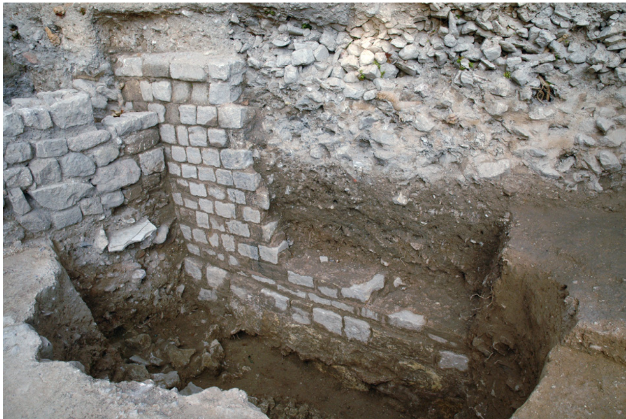
195 Parement extérieur de la courtine, mis au jour dans l'ancienne propriétés des Petites Soeurs des Pauvres, en 2010

Au sud de cette porte, ce sont les arguments archéologiques a silentio et les plans anciens qui permettent de restituer la suite de son parcours. Grâce aux fouilles réalisées sur deux parcelles situées en rive ouest de la rue des Bœufs (n° 1 de la route de Galice et n° 8 de la rue des Bœufs), nous savons que l'enceinte ne poursuivait pas sa trajectoire selon la même direction nord/sud qu'elle affecte au nord. Dans ces terrains, ont été mis au jour des sols à caractère hydromorphe, où les seuls aménagements antiques sont des drains et des fossés évoquant une occupation agricole. Nous nous trouvons donc ici très certainement extra-muros, ce qui impose de décaler vers l'est la fortification. L'analyse des plans de la ville suggère de lui faire emprunter la rue des Bœufs jusqu'à la rue Irma-Moreau, où elle devrait croiser la courtine sud.