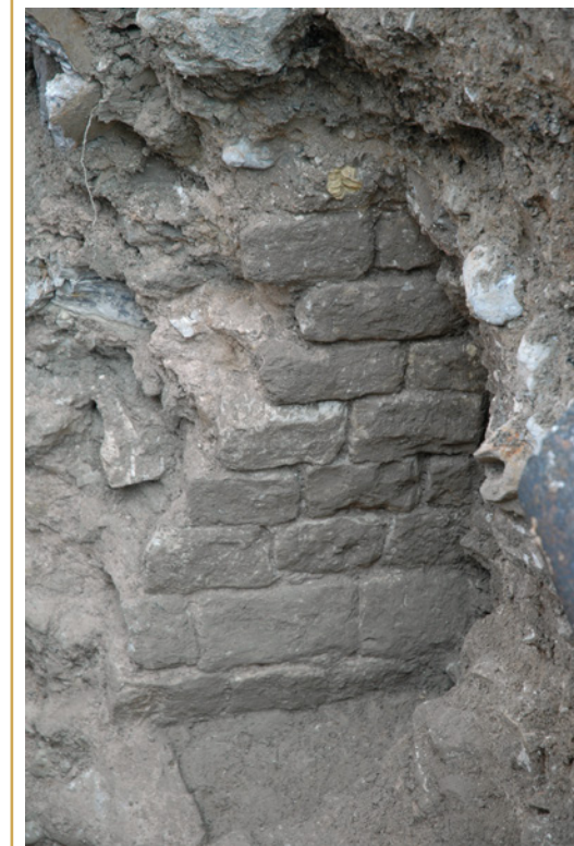
196 Parement intérieur de la tour de flanquement nord de la porte d'Arles

Dans l'ancienne propriété des Petites Sœurs des Pauvres, les deux sondages ouverts au pied de la courtine ont montré que celle-ci avait été construite dans des sols de culture qui ne sont pas datés. L'épaisse couche de brasier qui s'est constituée lors de son érection et qui a fait office de sol de circulation, n'a pas livré de mobilier non plus. Les premières informations chronologiques sont fournies par les niveaux de circulation ou de remblais qui la surmontent et en particulier un bol en céramique sigillée de Gaule du Sud dont la production ne démarre pas avant les années 40 apr. J.-C. (type Drag 24/25b). Les niveaux postérieurs sont attribuables à la période flavienne. L'enceinte est donc antérieure au milieu du 1er siècle ap. J.-C.