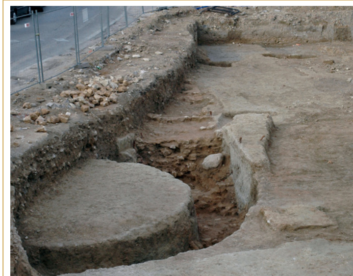
194 Tour et portion de courtine découvertes en rive nord de la rue Irma Moreau, en 2007