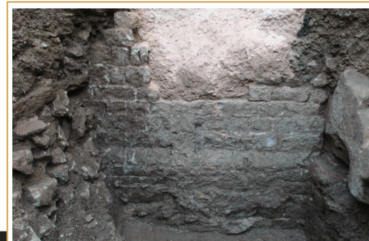
197 Parement externe du mur nord de la tour de flanquement nord de la porte d'Arles