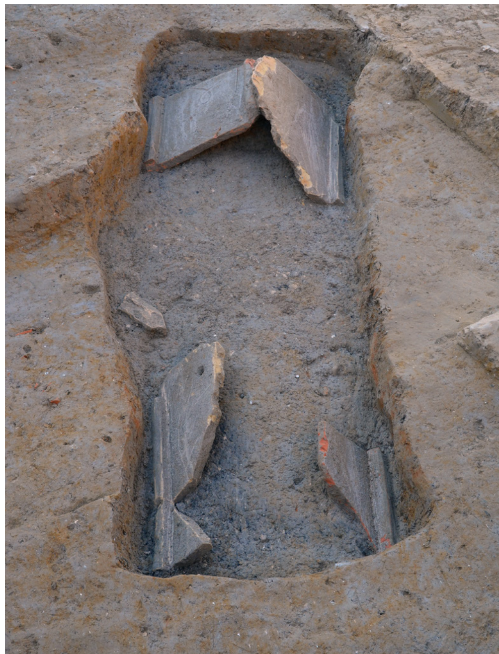
395 La tombe avec sa couverture en tuiles.

Pour modeste qu'il soit, ce dossier vient ainsi compléter notre connaissance de l'occupation des rives de l'Arc à l'époque antique. Avec le sanctuaire de la Grassie qui lui face, de l'autre côté de l'Arc, il s'inscrit dans un paysage qui apparaît désormais bien occupé et que les fouilles préventives révèlent progressivement.