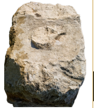
443 Restes du pulvinus sur le dessus de l'autel.