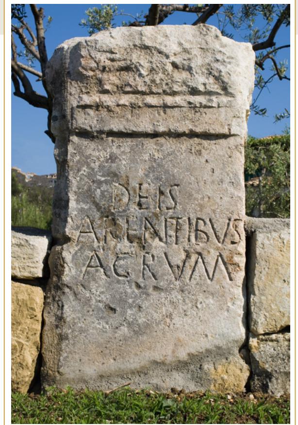
442 L'autel aux « Dieux Parents » installé sur le rond-point au croisement de la D18 et de la D543. Vue de la face inscrite

Pour l'inscription d'Éguilles, l'absence de contexte archéologique et le caractère laconique du texte imposent la prudence sur son interprétation : autel funéraire ou offrande dans le cadre d'un sanctuaire, il est bien difficile de trancher.