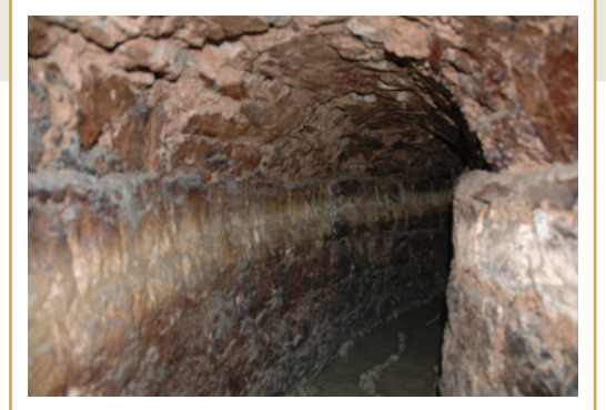
440 Intérieur du conduit (specus) de l'aqueduc.