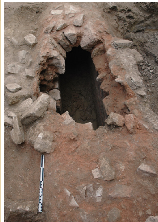
439 Apparition de l'extrados de la voûte de l'aqueduc dans une tranchée de diagnostic.

Au moment de sa découverte, le mode de construction et la localisation de ce tronçon d'aqueduc nous ont fait penser qu'il s'agissait peut-être de l'aqueduc de Traconnade. Plusieurs segments de ce dernier en sont connus, notamment à Meyrargues où il franchissait le vallon des Arcs sous la forme d'un pont-aqueduc dont cinq piles d'arcades sont encore visibles. Mais l'orientation du fil d'eau pose problème. La galerie qui a été reconnue sur une distance de 100 m en deux segments, a permis d'établir de manière certaine que le sens d'écoulement de l'eau s'effectuait depuis le sud-ouest vers le nord-est. Or l'aqueduc de Traconnade devait s'écouler de manière assez régulière du nord vers le sud. Il est probable que la galerie découverte aux Platanes n'appartenait pas à l'aqueduc lui-même mais plutôt à une de ses dérives. L'installation de branchements privés sur les réseaux publics était courant et permettait d'alimenter les propriétés agricoles et les thermes des riches villae suburbaines.