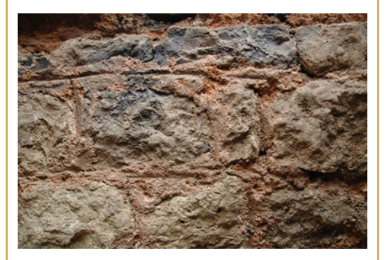
441 Détail de la maçonnerie du parement interne du specus avec l'enduit hydraulique encore en place.