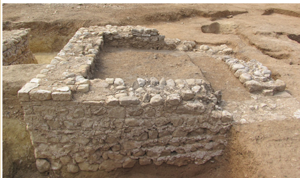
390 Mode de construction des murs