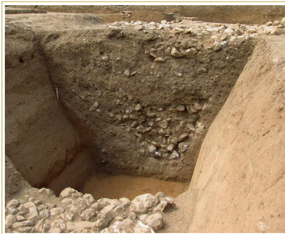
387 Vue en coupe du grand fossé et de ses différents complements.