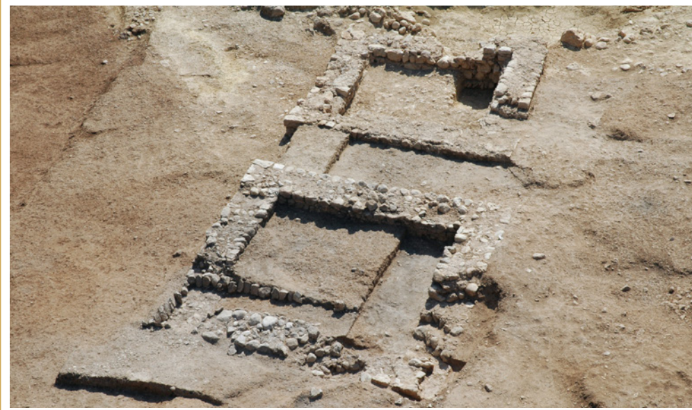
389 Deux des édicules du IIe s. ap. J.-C.