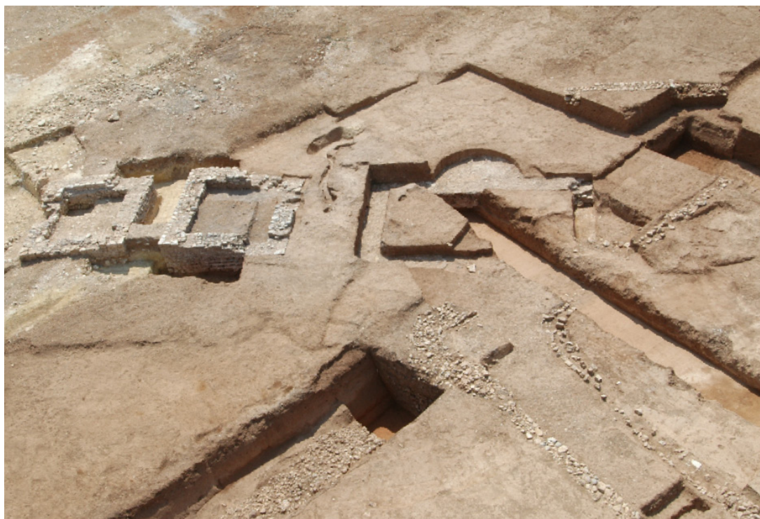
388 Vue des quatre édifices appartenant peut-être à un sanctuaire.

C'est à ce moment-là, probablement à la fin du I er siècle, qu'un large fossé a été creusé, à environ 15 à 20 m au sud du fleuve (387). Plus ou moins parallèle au cours d'eau, il était rejoint par deux canaux perpendiculaires provenant du nord. L'ensemble offrait des dimensions imposantes : le bras principal, profond de 1,60 m, courait au moins sur 90 m du nord-est au sud-ouest, et sur des largeurs variant de 2,50 à 3 m. Ce fossé a certainement eu une fonction de délimitation des terrains. Quant aux autres structures, soit elles servaient à capter les eaux conduites par ce dernier, soit, au contraire, elles évacuaient celles qu'elles drainaient dans son cours.