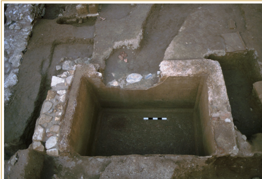
382 Une des cuves.

À l'image de l'établissement agricole de Signoret, la villa découverte dans l'Espace Forbin devait, participer d'un semis de petits domaines agricoles, répartis tout autour de la ville et qui, contrairement aux grandes exploitations installées dans le territoire, contribuaient sans doute plus à la consommation urbaine qu'aux besoins du commerce extérieur. Outre le témoignage de ses activités agricoles suburbaines, un des intérêts majeurs de cette villa a aussi consisté dans la révélation de l'organisation de son domaine et le soin apporté à sa clôture, qui le protégeait des éventuelles intrusions depuis la voie Aurélienne et le chemin qui se greffait sur elle, à l'est.