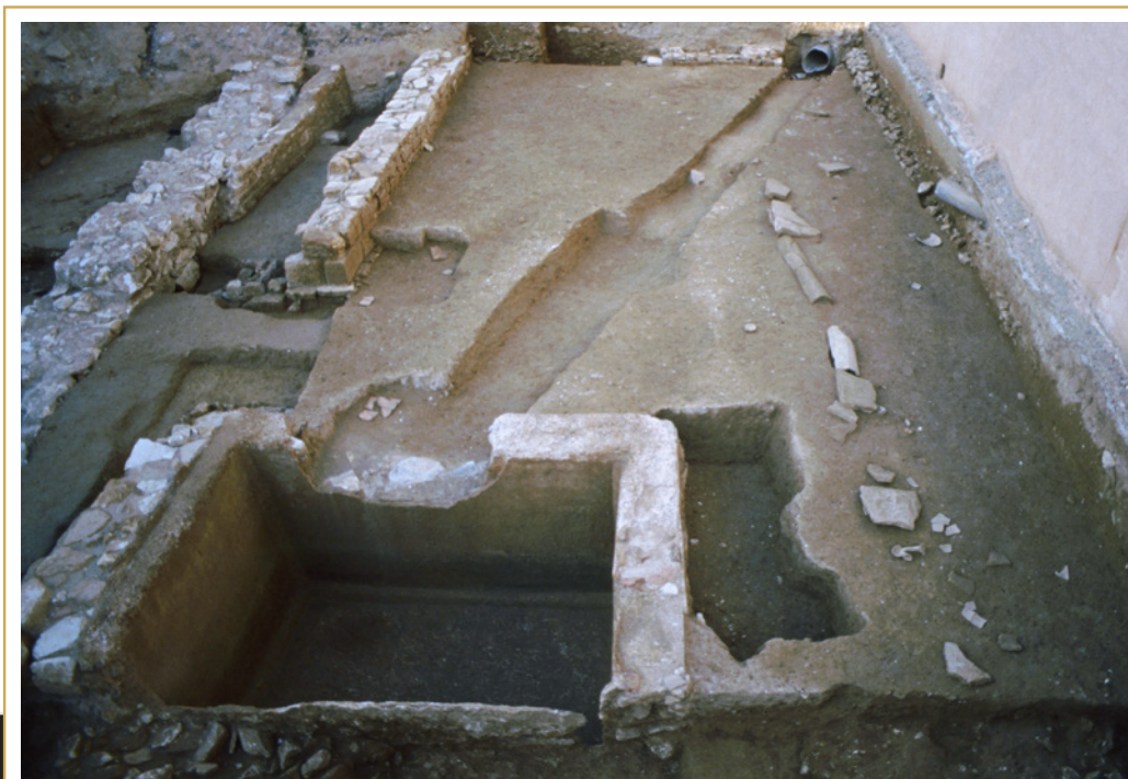
384 L'ancien cellier dans lequel les doliums ont été enlevés.