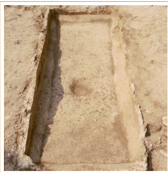
383 La nouvelle cuve installée pour répondre à un accroissement de production.