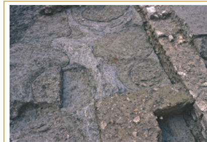
361 À l'emplacement de la voie Georges-Pompidou, une des fosses d'extraction d'argile vue en coupe.

La réponse est sans doute à chercher dans les parcelles qui environnent la zone explorée en 2007, si tant est que l'archéologie la fournisse un jour.