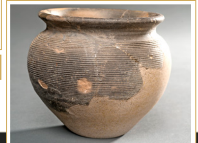
360 Pot en céramique tournée.