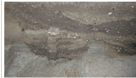
358 Vue des fosses à doliums aménagées dans le cellier.