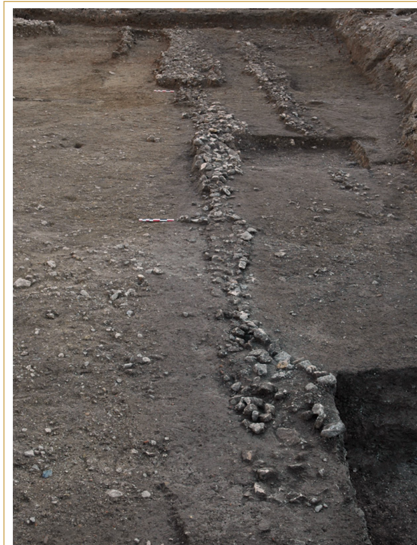
362 Fossés révélés par les fouilles de la voie Georges-Pompidou, en 2007.