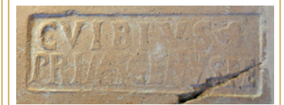
359 Marque Primigenus sur un couvercle de dolium.