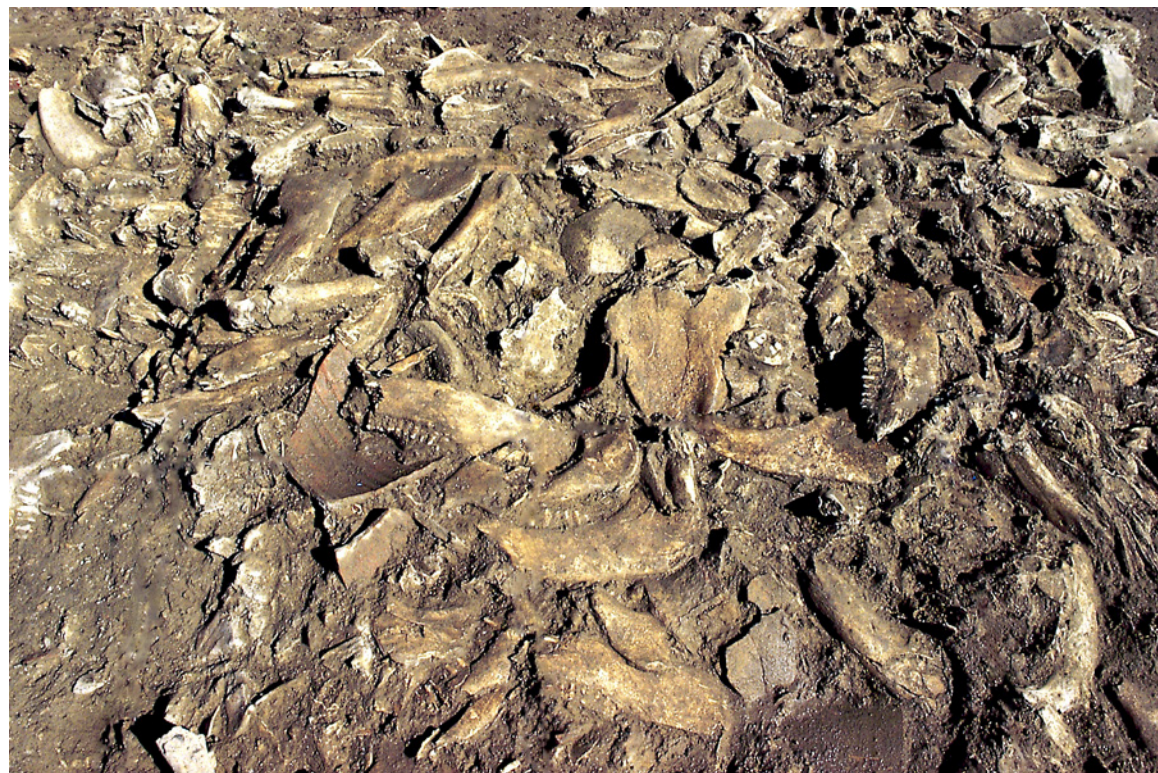
344 Détail des mâchoires composant les déchets de l'activité de charcuterie.