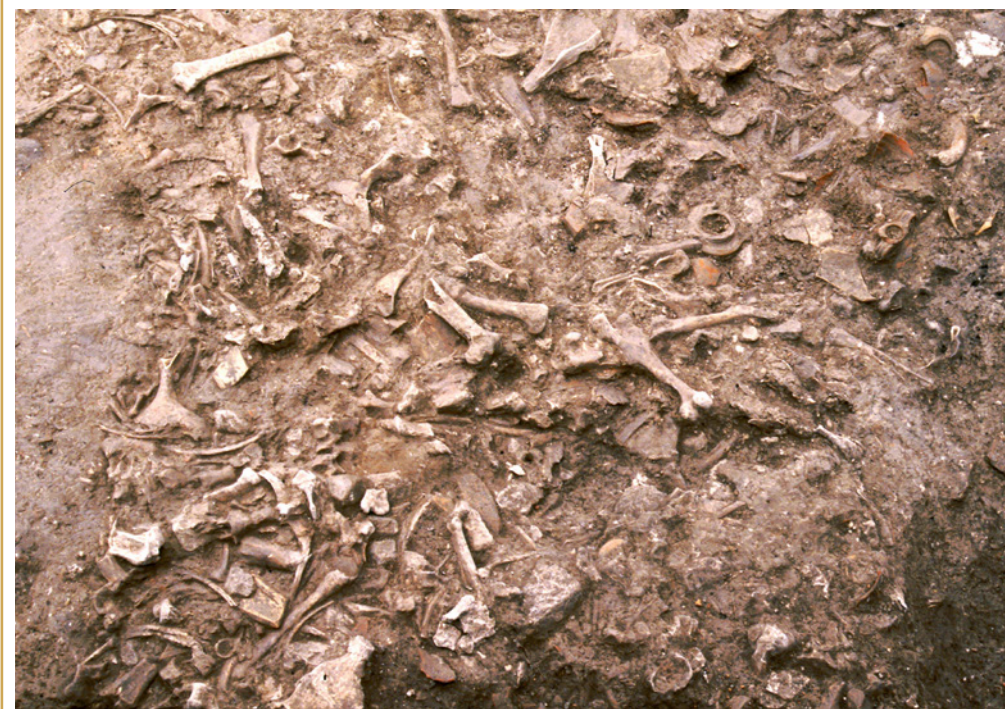
346 Détail de l'un des dépotoirs de tabletterie.

Les modalités de formation de ces dépotoirs sont par ailleurs similaires : les déchets ont été apportés en plusieurs fois, mais toujours dans la même dépression ou dans le même fossé, sans que leurs différents dépôts soient séparés par une phase de sédimentation. Ces observations indiquent que les déversements ont été effectués dans un intervalle de temps relativement court, chaque artisan revenant régulièrement sur un même lieu pour se débarrasser de ses débris.