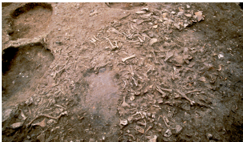
345 Vue générale de l'un des dépotoirs de tabletterie exhumé dans la partie sud de la nécropole de la route de Marseille.

Enfin, chaque artisan utilisait des outils qui lui étaient propres, ce qui facilite l'identification des dépôts : la découpe de boucherie se pratiquait toujours à l'aide d'un tranchoir et d'un couteau laissant des traces bien particulières. Le travail de l'os et de la corne requerrait la scie, qui, dans l'Antiquité, n'a jamais été utilisée, comme de nos jours, pour le travail de boucherie. Elle permettait de prélever, sans l'abimer, la partie de l'os servant à confectionner des objets.