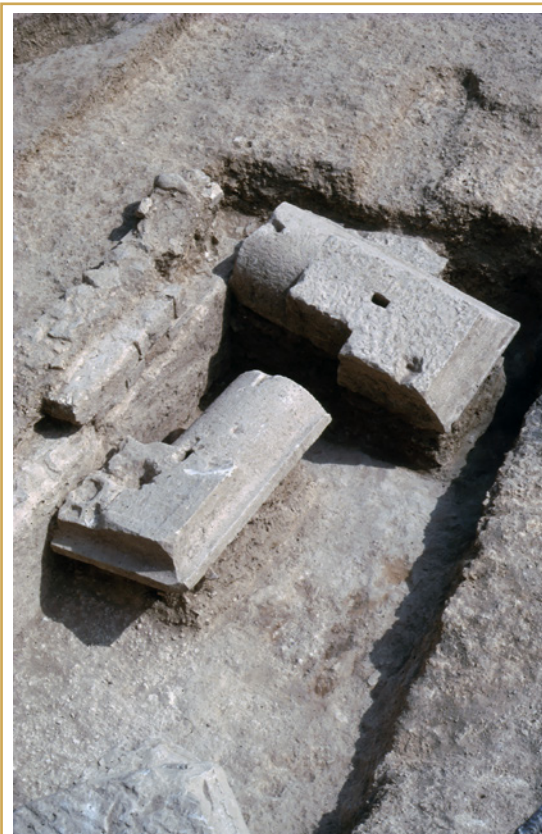
321 Les éléments de couronnement en place contre le mur de terrasse.

Dans la nécropole nord-ouest qui nous occupe, plusieurs indices plaident en faveur d'une pareille topographie relevant de ce que l'on appelle le modèle de la « Gräberstrasse », c'est-à-dire de la colonisation des voies par les nécropoles. L'avenue Marius-Jouveau, au nord de laquelle se trouve le mausolée, prolonge, en effet, vers l'ouest l'avenue Henri-Pontier, et ces deux voies ont en commun de suivre le tracé du rempart antique (318). Voir dans ces deux rues l'héritage d'une lice extérieure n'aurait rien d'incongru, surtout que la fortification était, ailleurs, longée d'une voirie périphérique, notamment à l'ouest. Prolonger cette lice sous la forme d'un chemin vers l'ouest serait d'autant moins aberrant qu'elle est bordée par une série de découvertes funéraires. Parmi elles, une autre petite aire dallée, reconnue quelques mètres plus à l'ouest encore, dans cette même avenue Marius-Jouveau, en 1977, pourrait signaler la présence d'un second édicule funéraire, établi en bordure de voie.