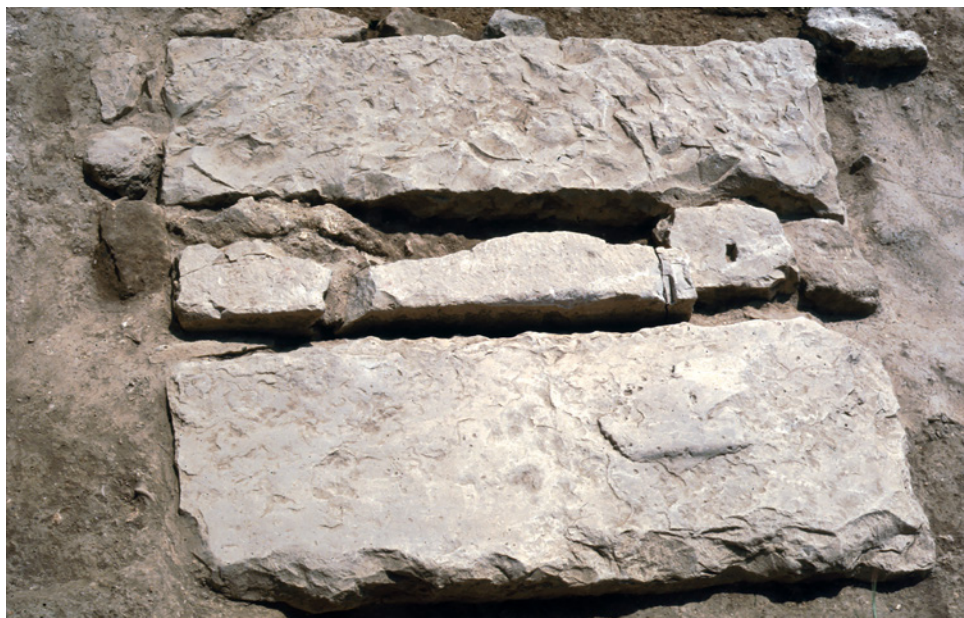
320 La base du mausolée.

Au moins deux, peut-être trois phases de fréquentation s'y sont succédé durant l'Antiquité. Des niveaux de charbons mêlés d'ossements et de balsamiques fondus, montrent que le site a d'abord accueilli des sépultures à crémation. Par la suite, il a été aménagé en terrasse pour accueillir le petit édifice que nous allons voir. Aux IVe-Ve siècles enfin, au moins un sarcophage de pierre a été installé à quelques mètres de ce dernier.