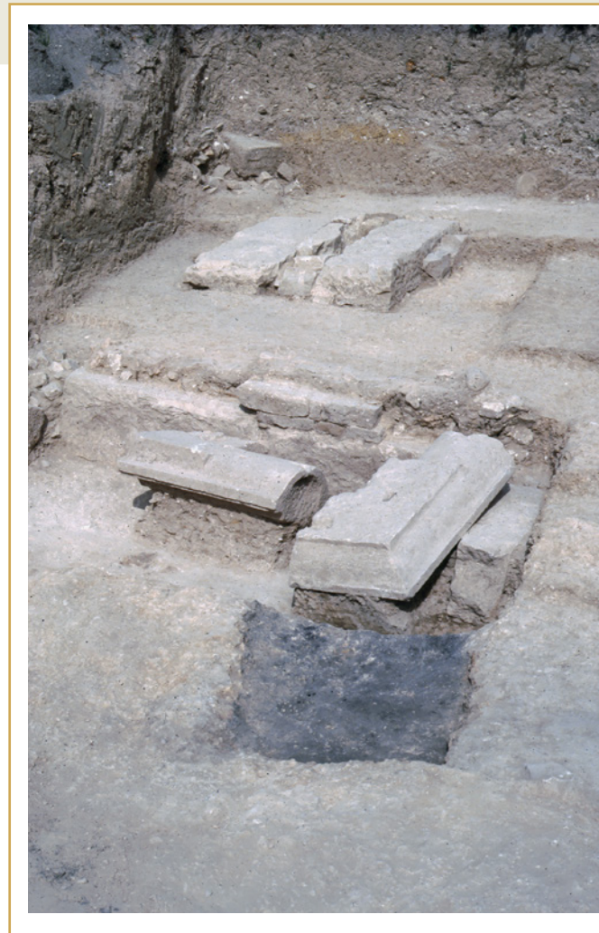
319 Vue d'ensemble des vestiges appartenant au monument funéraire du 4, rue Marius-Jouveau.