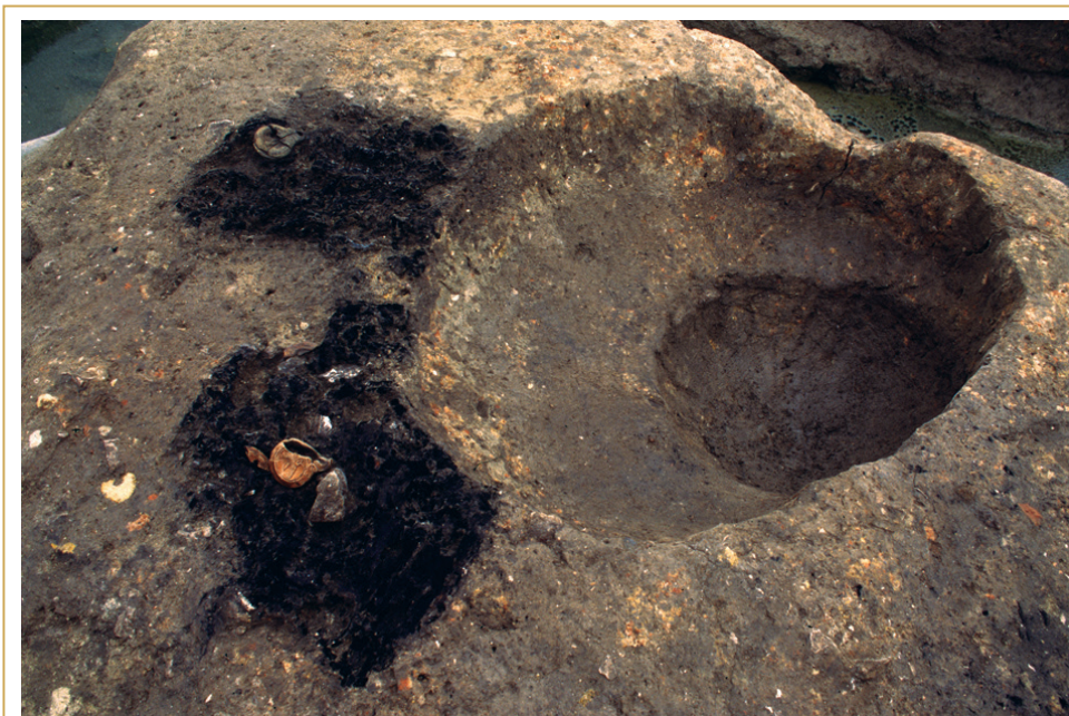
316 Deux dépôts charbonneux aménagés à proximité d'une tombe, ici entièrement fouillée. On y voit des lampes posées sur les charbons de bois.

Il montre aussi une très grande unité dans les pratiques funéraires. Ressortissant exclusivement au rite de la crémation pour l'ensemble de la population immature et adulte, celles-ci s'expriment sous des formes très semblables, qu'il s'agisse des tombes-bûchers ou des sépultures à crémation en dépôt secondaire. L'aménagement des tombes apparaît standardisé : architectures et dimensions similaires, même répertoire d'ossuaires, mêmes types de dépôt. Le rituel qui encadre l'ensevelissement des périnataux appelle des remarques semblables. D'un point à l'autre de la nécropole, il se caractérise par la même simplicité et une même topographie. Autant de similitudes qui suggèrent le recrutement d'une population à la mentalité et aux traditions relativement homogènes.