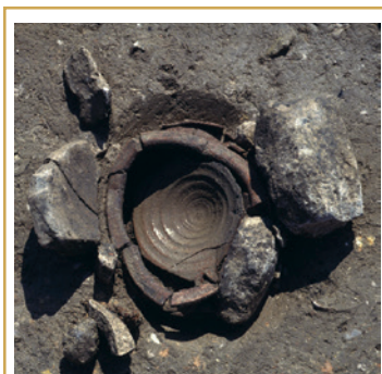
311 Urne cinéraire en céramique protégée par un calage de pierres.