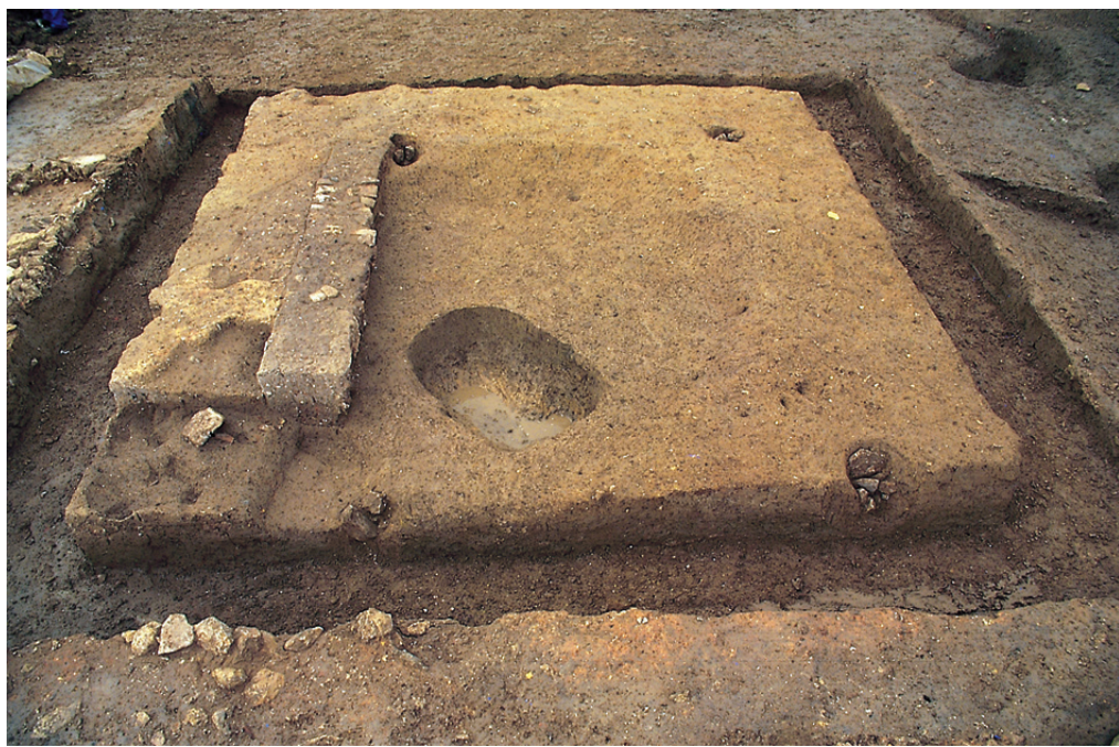
306 Enclos funéraire ayant accueilli une crémation primaire.

N'occultant en rien la vision des paysages alentour, ces édifices funéraires étaient strictement alignés sur les rives de la voie et toujours orientés vers elle, montrant l'attraction que celle-ci exerçait sur cette « petite ville des morts ». Quelles qu'en soient la forme et la richesse, la tombe est avant tout tournée vers ceux qui restent, les vivants, auxquels revient, ne serait-ce que par leur seul regard, de faire vivre la mémoire du défunt. Elle impose de ce fait une relation nécessairement dialogique.