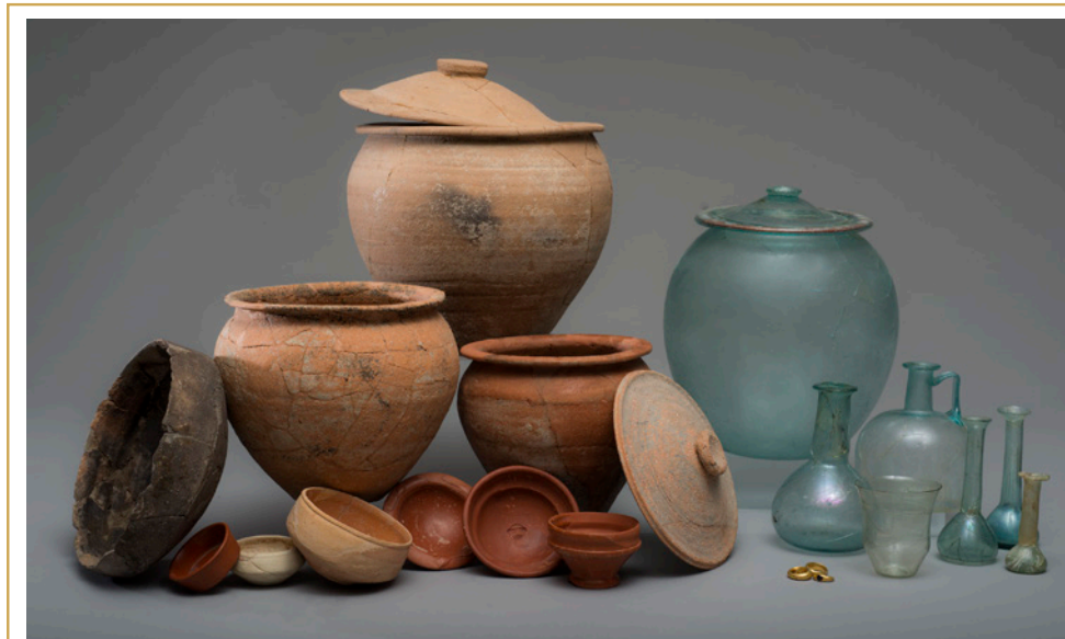
313 Répertoire des objets les plus fréquents dans les sépultures.

En ligne générale, le répertoire des objets qui accompagnent le défunt, est relativement standardisé (313). Il comprend des ustensiles liés à la toilette (des balsamiques qui sont des fioles à parfum (314), des miroirs en bronze), ou à la parure (bijoux), de la vaisselle qui devait contenir des liquides ou des aliments (coupes, gobelets ou cruches en verre ; pots, coupelles et cruches en céramique), des lampes aussi, ainsi que des petits vases en céramique miniature qui semblent avoir été fabriqués spécialement pour un usage funéraire ou rituel. Certaines sépultures recelaient une monnaie en bronze, l'obole à Charon, qui permettait au mort de s'acquitter du tribut nécessaire à son passage dans l'au-delà.