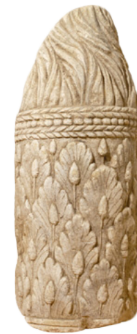
307 Torche en pierre calcaire décorée de feuilles de chêne