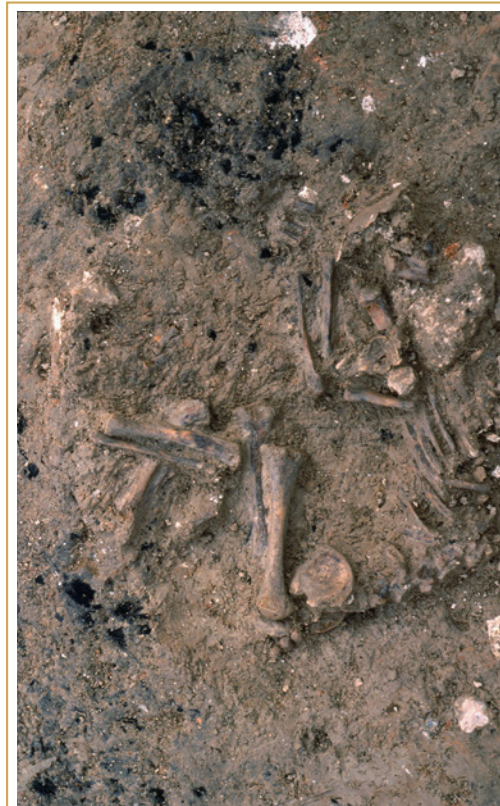
308 Sépulture de périnatale.

Les quatre tombes-bûchers identifiées ont été trouvées en trois endroits de la nécropole, et toujours à l'extérieur des enclos funéraires, ce qui témoigne d'une partition dans les rites selon les lieux définitifs de sépulture (309).