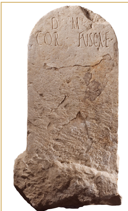
315 Epitaphie en pierre calcaire portant l'inscription D. M. COR. FUSCAE. « Aux dieux Mânes de Cornelia Fusca ».