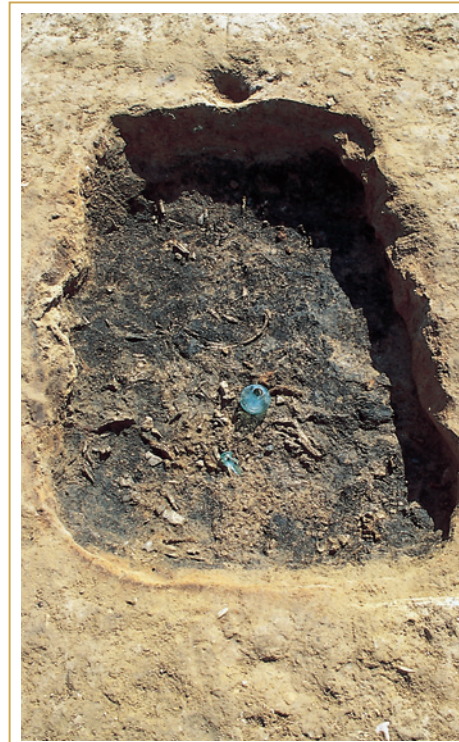
309 Tombe-bûcher. Un balsamaire en verre a été déposé sur les résidus du bûcher, une fois la combustion terminée.