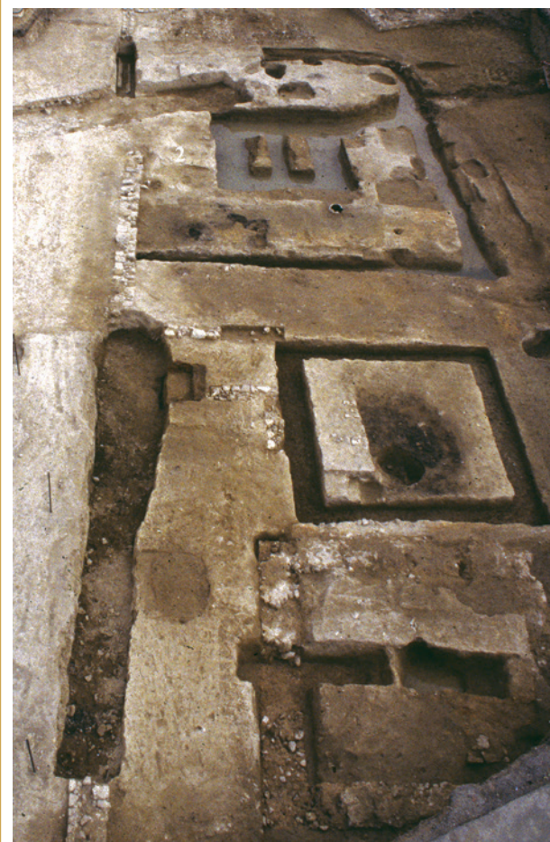
305 Un des noyaux funéraires de la nécropole avec ses enclos et ses édicules seulement perceptibles grâce aux tranchées laissées par leurs murs récupérés.