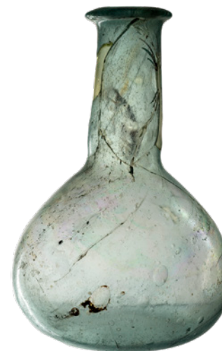
314 Fiole à parfum ou à onguent en verre, déposées dans les sépultures.