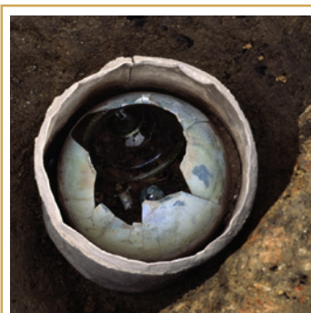
312 Urne cinéraire en verre protégée par un coffre en plomb. On perçoit, à l'intérieur du vase, une coupelle en verre lui ayant certainement servi de couvercle, ainsi que les ossements brûlés du défunt.