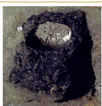
310 Fosse remplie de charbons prélevés sur le bûcher, dans lesquels a été déposé le vase cinéraire, ici écrêté par les labours.