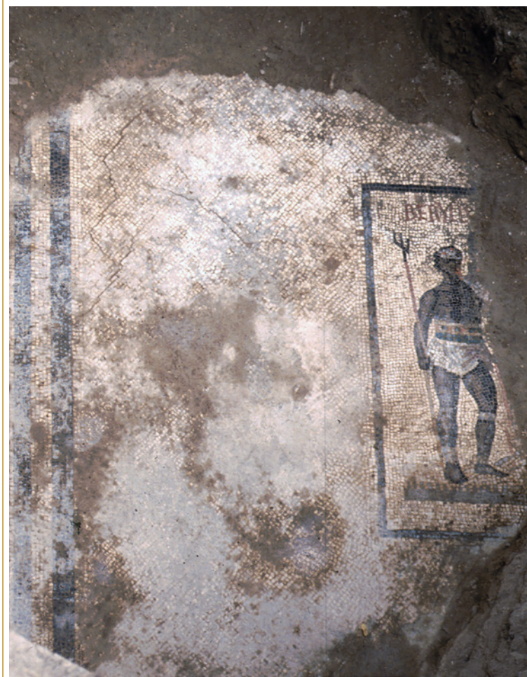
243 Vue de la mosaïque au gladiateur au moment de son dégagement.

Ce pavement est daté de la fin du I er s. ap. J.-C.