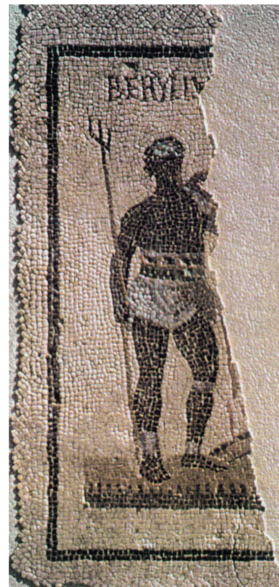
244 Détail du gladiateur numide Beryllus