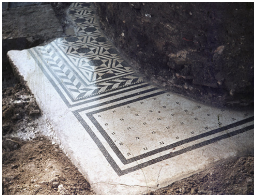
242 Mosaïque à décor géométrique en opposition de couleur, trouvée en 1974

À l'ouest de ces pièces, ont été rapidement reconnus un sol en marbre, ainsi que plusieurs autres en béton, un bassin, des fragments de dallage et de colonnes, deux grandes jarres en céramique (dolia). D'après les informations orales fournies par des riverains, témoins des travaux, aurait également pris place, en partie ouest du chantier, une batterie de dolia qui évoque une zone d'entrepôt ou une boutique. Les vestiges sont datés, sans plus de précision, entre les Ier et IIIe s. ap. J.-C.