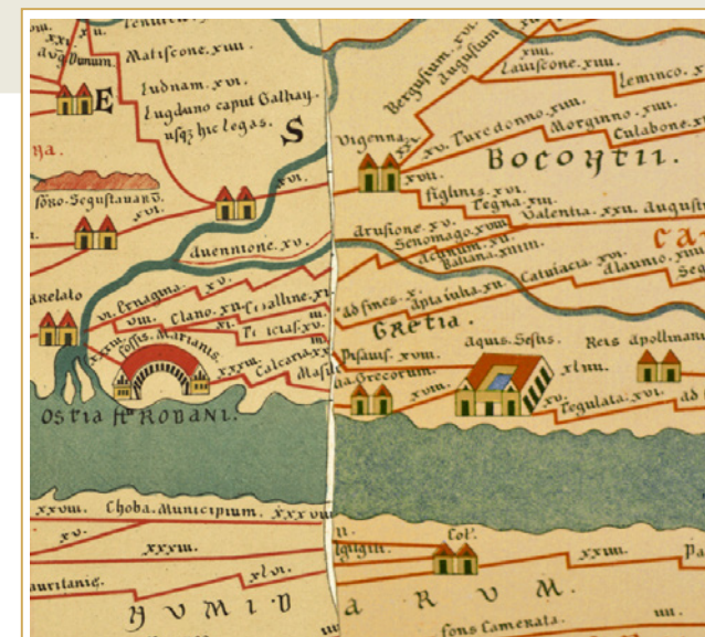
234 Anomalie parcellaire visible sur l'orthophoto du centre historique d'Aix-en-Provence, au nord du cours Mirabeau.