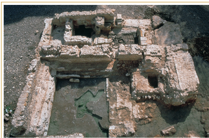
236 Vestiges des bains de cure lors de leur ré-exhumation, en 1996.

Malgré les importantes dégradations qu'ils ont subies lors des travaux d'aménagement du site, au début du XXe s. (construction de la salle de restaurant « l'Atrium » en 1925 et de la piscine thermale), les vestiges laissent voir un ensemble plus complexe que celui dont rendait compte le plan établi en 1921. Dégagés sur 130 m 2 de superficie, ils ont fait l'objet de trois phases d'aménagement dont la chronologie absolue n'a pu être établie, l'ensemble de la stratigraphie ayant été enlevée lors des fouilles de 1921, et le mobilier archéologique alors exhumé, perdu. D'autres reprises architecturales, plus tardives, y sont également perceptibles, mais tout aussi impossibles à dater.