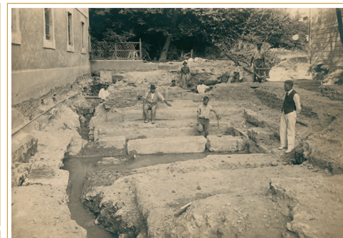
235 Vestiges des bains de cure lors de leur découverte, en 1921.