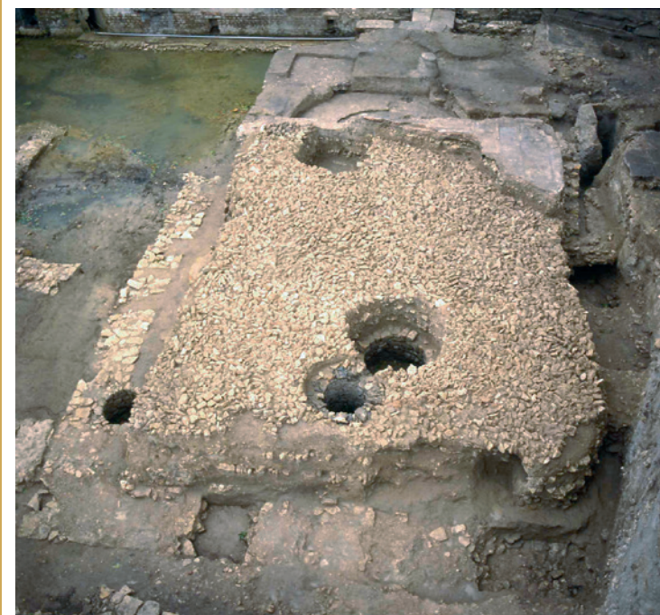
239 Une des grandes salles de l'établissement thermal oriental.