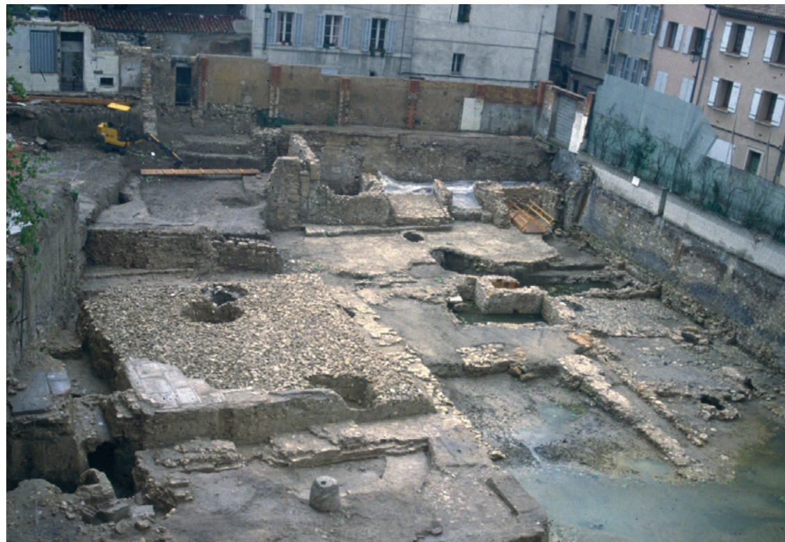
237 Vue générale prise depuis l'ouest des grandes salles qui ont succédé à l'édifice à nefs multiples.

Par la suite, le praefurnium a fait l'objet de petits réaménagements. Le canal de chauffe a été réduit, et ses piédroits peut-être refaits.