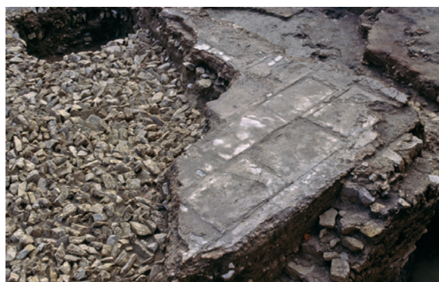
240 Empreintes des dalles en marbre qui recouvraient le sol de l'une des grandes salles.

Parmi les interprétations possibles pour ces puissantes et remarquables constructions, est celle de pièces monumentales ou de bassins, ce qui a conduit à envisager une possible appartenance à un établissement thermal, indépendant des bains de cure. Faute de mieux, cette hypothèse reste ouverte. La construction de ce complexe monumental pourrait être contemporaine de la première étape de restructuration des bains de cure. Elle a, en effet, entraîné le démontage du bâtiment à nefs multiples qui se trouvait à son emplacement, et l'on retrouve certains des matériaux utilisés dans les constructions de ce dernier – les blocs en pierre – les blocs en pierre de Bibémus notamment – en remploi dans les maçonneries de ces bains. Elle semble aussi s'être inscrite dans un vaste programme urbain, car c'est à peu près à la même époque qu'un autre monument, tout aussi énigmatique, fut édifié au nord du site des Thermes Sextius, et que la voirie fut refaite, dans un même dessein de monumentalisation : pose de dallages en pierre froide et mise en place d'un pavement de mosaïque, dans l'emprise d'un portique de rue. On sait, d'autre part, que ces salles sont restées longtemps en usage sans qu'on puisse savoir si leur fonction originelle s'est maintenue. La récupération de leurs murs semble, en tout cas, avoir été tardive ; elle pourrait même ne pas être antérieure au Moyen Âge.