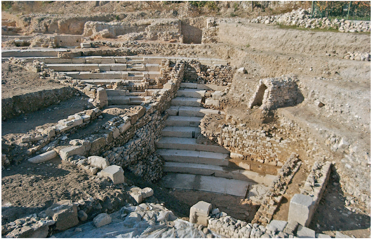
223 Les vestiges du théâtre vus depuis l'est

Sa construction relève d'une technique mixte, associant installation d'une partie de la cavea dans le sol naturel et substructions accompagnées de remblaiements. En élévation, la majeure partie de ses maçonneries est en petit appareil très régulier, tandis que la pierre de taille a été réservée aux parties nobles de l'édifice : son mur de façade par exemple et peut-être aussi le bâtiment de scène.