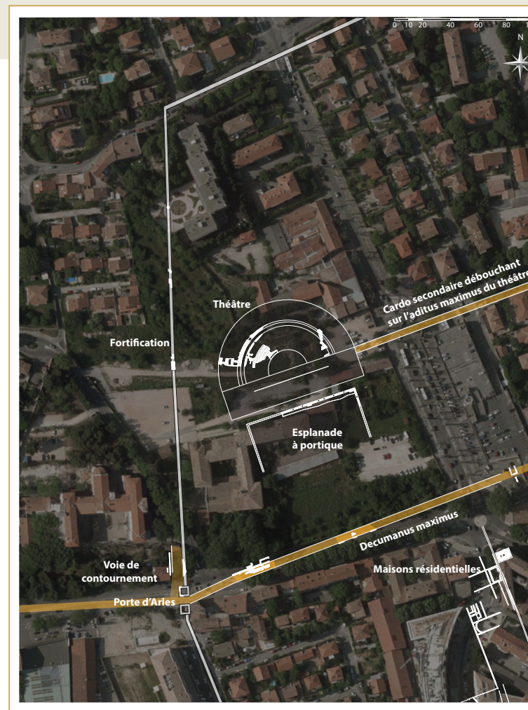
222 Localisation du théâtre sur fond d'orthophoto.

On sait, d'autre part, que l'édifice de spectacle et sa porticus post-scaenam dominaient d'environ deux mètres le decumanus maximus. Ils se développaient, en effet, sur une terrasse aménagée au nord de ce dernier, à laquelle on accédait par une entrée monumentale réservée dans un puissant mur de soutènement. Ainsi, pour quiconque entrant dans la ville par l'ouest, le théâtre devait offrir la masse imposante de son architecture, bien visible par-dessus l'enceinte. Avec son esplanade à portique, il formait par ailleurs une combinaison classique, tirant ici le meilleur parti de la topographie de la ville.