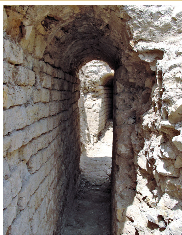
226 Collecteur flanquant à l'ouest l'ambulacre