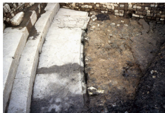
227 Couloir de circulation séparant la conque des gradins (à gauche) de l'orchestra (à droite) dont on voit le sol en béton

Au niveau de la cavea, a été mis au jour un escalier radial qui détermine deux travées (cunei). Largues de 0,40 m, les marches ont été taillées dans les gradins et sont pourvues de petits chenaux obliques qui facilitaient l'évacuation des eaux de surface. Au contact entre la conque des gradins et l'orchestra, court un couloir large de 1,48 m, qui conserve encore une engravure témoignant de la présence d'un balteus (garde-corps) en pierre disparu (227).