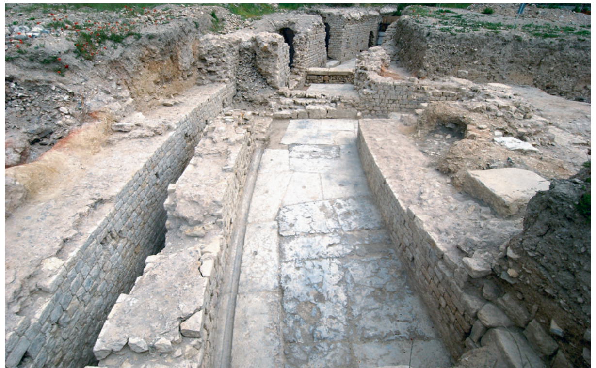
225 Le couloir de circulation souterrain vu depuis le sud

Le long du mur oriental de ce couloir de circulation souterrain court un caniveau qui évacuait les eaux de ruissellement vers la galerie technique qui le borde à l'ouest (226). Mesurant 0,60 m de large dans-œuvre et voûté, ce collecteur était destiné à assurer l'étanchéité de l'ambulacre, dont il recueillait les eaux de ruissellement, abondantes par temps de pluie. Enfin, dans la partie ouest de l'ambulacre, ont été dégagés les départs de trois vomitoires ; un quatrième est restituable à l'est, dans la partie du théâtre explorée en 1990.