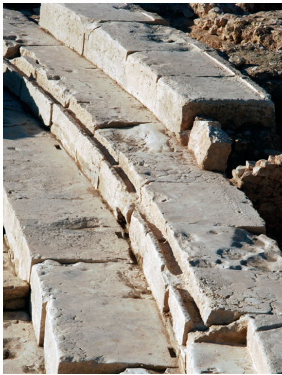
224 Détail des gradins en pierre froide

Les gradins mesurent, quant à eux, 0,80 m de profondeur et 0,40 m de hauteur, dimensions communes à la plupart des édifices de spectacle régionaux (224). Moins large (0,4 m), le gradin inférieur servait de marche pied.