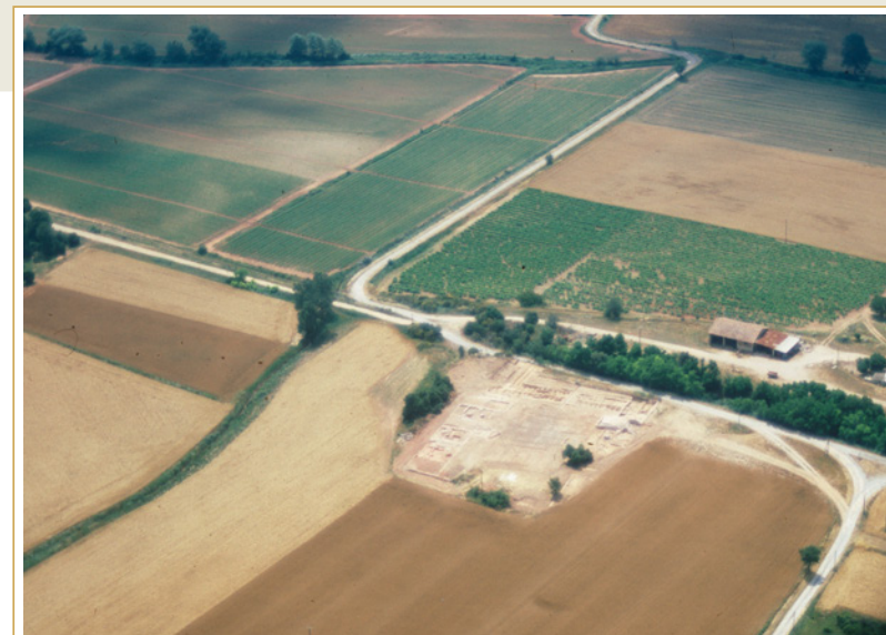
428 Plan de situation des sites antiques du Puy-Sainte-Réparate