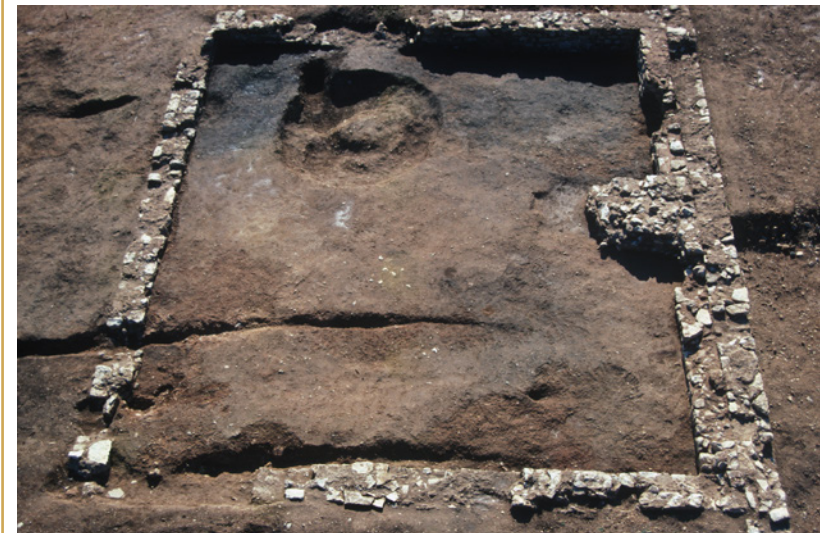
435 Fosse circulaire pour contrepoids à vis dans la salle de manœuvre 20.