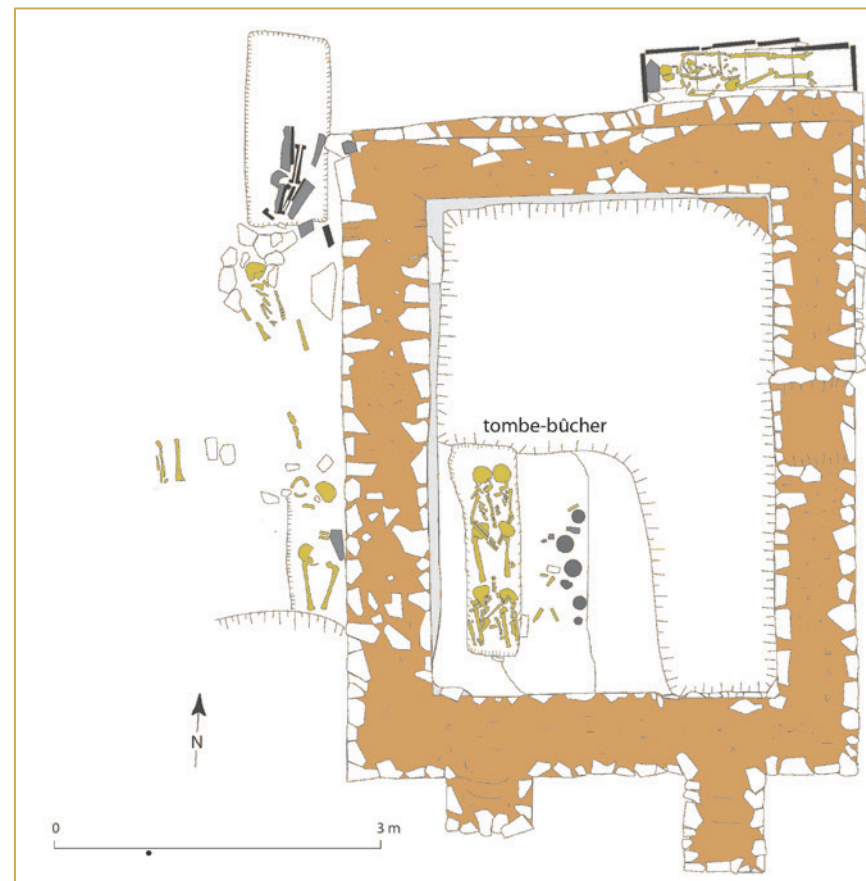
438 Plan du mausolée et des tombes.

Plus à l'ouest, également au bord de la Durance, une tête de Bacchus a été autrefois découverte en remploi dans la façade de la chapelle Notre-Dame d'Astor sur la commune de Peyrolles-en-Provence. Elle provient certainement d'une villa toute proche repérée près d'abondantes sources, à la limite de la commune de Meyrargues. Enfin, sans préjuger du processus qui présidait au choix des saints patrons des communautés du haut Moyen Âge, il n'est pas indifférent de signaler dans ce contexte que la commune de Jouques, limitrophe de Rians et de Peyrolles, est placée sous le patronage de saint Bacchus, vénéré ici sous la forme de San Bacchi. Serait-ce un souvenir de cultes antiques ?