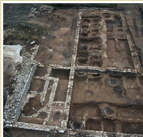
430 De gauche à droite : pressoirs et fouloirs 1, cuves 2 à 6, chai 7/8.