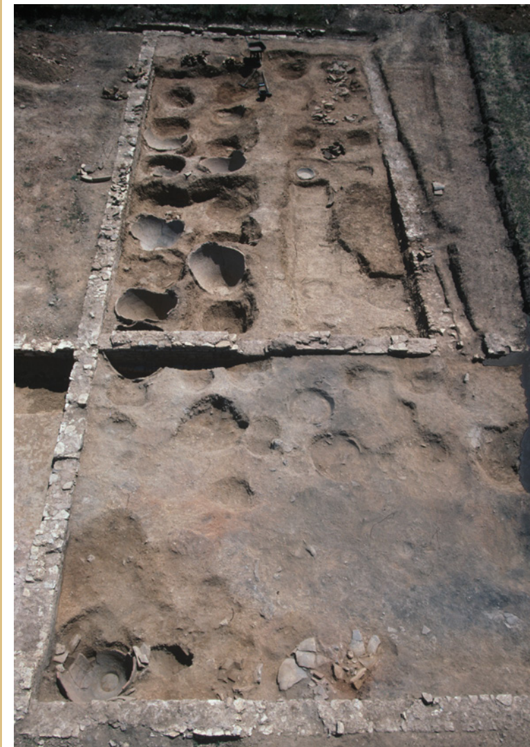
432 L'aile nord du chai en cours de fouille.

La datation de cet état n'a pu être précisée. Un fragment de sigillée sud-gauloise, datable autour des années 100 de notre ère et trouvé dans un remblai lié au bâtiment 36, indiquerait une datation postérieure au début du second siècle.