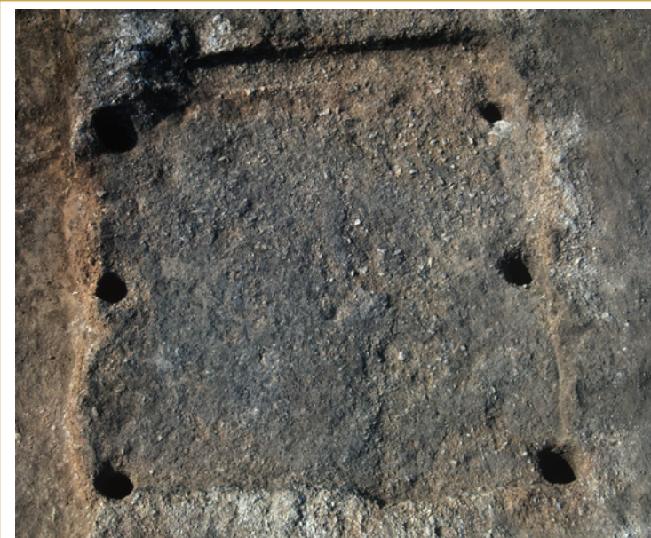
437 Salle de manœuvre 20, emplacement d'un contrepoids à vis.

Elle est attestée par un fond de cabane mesurant 4,50 par 4,30 m de côté, excavé dans le substrat immédiatement à l'est de la pièce 46 (437). La cabane était formée de six forts poteaux bordant la dépression. Aucun matériel datant n'était associé à cette structure, mais par comparaison avec ce qui est connu ailleurs, on peut l'attribuer à des habitants d'origine germanique qui, peut-être dans le courant du VI e s. ap. J.-C., ont dû s'installer à proximité immédiate des ruines de la villa.