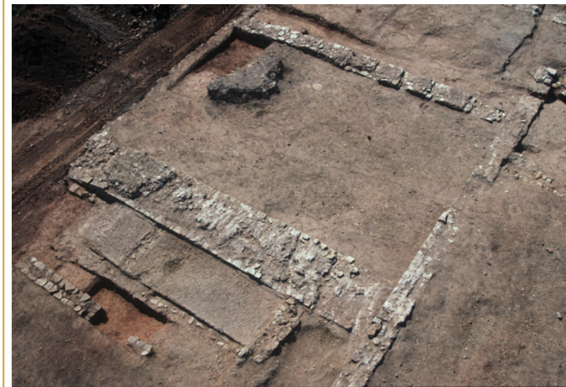
433 Pressoir 29, probablement à huile.