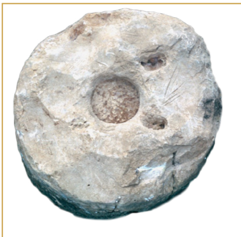
434 Bloc circulaire fixé à une vis.

Dans le courant de ce siècle (d'après l'émission d'un sesterce de Septime Sévère), la production de vin semble avoir diminué : des doliums furent retirés, le pressoir est et la partie orientale du chai furent laissés à l'abandon. Dans la partie ouest de ce dernier, la construction de deux murs transversaux contribua à créer une salle 7 qui reçut de nouvelles jarres selon un ordre un peu différent du précédent.