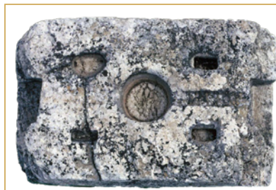
431 Bloc rectangulaire portant sur les côtés les encoches de fixation du treuil à câbles, et, dans un second état, sur la face supérieure, les quatre encoches de fixation de la vis, dont le culot se logeait dans le trou circulaire.

Dans la seconde moitié du Ier s. ap. J.-C., furent construits d'un seul jet de grands bâtiments vinicoles organisés symétriquement. Deux grands salles de pressurage surélevées par rapport au sol (1 et 20) accueillent chacune deux fouloirs et deux pressoirs (430) ; au milieu de ces salles, les murs sud étaient épaissis pour recevoir l'encastrement des arbres qui actionnaient les presses, disposées de part et d'autre d'un petit escalier les reliant aux salles de manœuvre 10 et 26. Les fouloirs situés aux extrémités, pouvaient être facilement alimentés, et le résidu du foulage transféré aux pressoirs adjacents. Ces pressoirs à levier étaient actionnés par des câbles tirés par des treuils fixés sur de gros blocs de pierre installés dans les salles de manœuvre (431). Le moût s'écoulait par des tuyaux de plomb dans des cuves situées au sud. Chaque ensemble de deux fouloirs et deux pressoirs était relié, au sud, à quatre cuves d'une capacité de 4 700 à 7 900 litres.