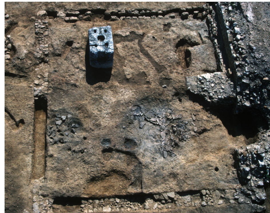
436 Réoccupation tardive dans la pièce de manœuvre 10.

Vers la fin du IV e s. ou au début du V e , le pressoir 29 fut à son tour démantelé et ses cuves détruites, à la place desquelles on créa une pièce d'habitation 33, limitée par des murs bâtis à la terre. L'ancienne pièce de manœuvre 10 fut démantelée, ses murs remplacés par des cloisons de bois renforcées par des poteaux ; à l'intérieur ont été trouvés les vestiges de forge et de foyer de fonte de métaux, fer et plomb récupérés sans doute dans les machineries (436). Le site semble avoir été complètement abandonné par la suite.