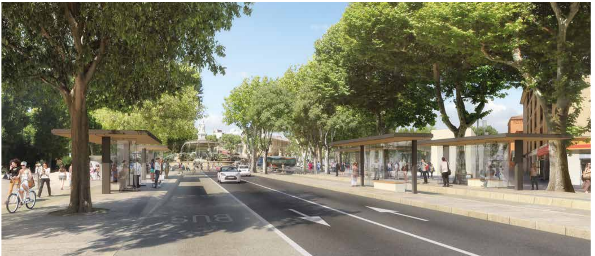
Le plus gros des travaux de l'Aixpress s'étalera sur l'année 2018. 2019 étant principalement consacrée aux opérations de plantation, d'installation de mobilier, de signalisation et de pose des équipements (ici vue de l'avenue Napoléon Bonaparte / Rotonde).