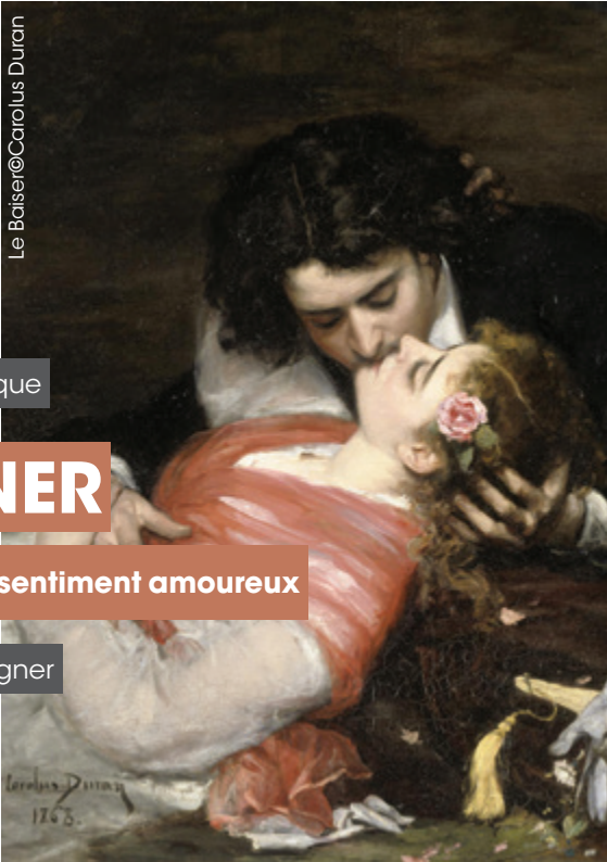
Le Baiser ©Carolus Duran

Entrée libre, dans la limite des places disponibles