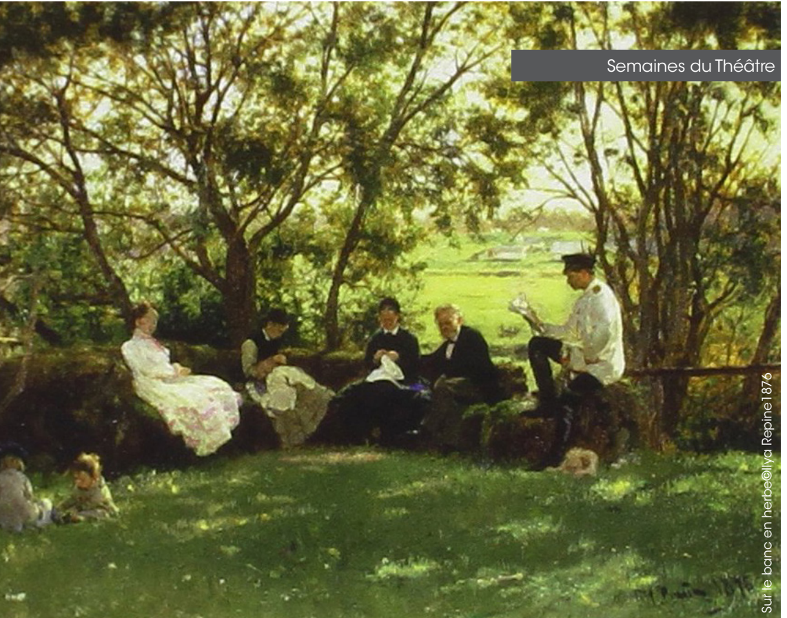
Sur le banc en herbe © Ilya Repine 1876

Elèves des classes d'art dramatique Professeurs | Isabelle Lusignan et Alice Mora