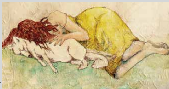
Foxy Lolie

«Raconte-moi l'histoire de ces deux hommes dont l'amitié, rompue par un menteur perfide, se transforma en hostilité et en haine.» Ainsi parle le roi de l'Inde au prince des philosophes chargé de lui apprendre à régner. Ainsi débute l'un des chapitres de ce grand classique de la littérature arabe qu'est Le Livre de Kalila et Dimna, écrit par Ibn al-Muqaffa' au VIII e siècle, d'après un recueil ancestral de contes animaliers venus de l'Inde lointaine. Reprenant la fable du Lion dont l'amitié avec le Bœuf est calomniée par l'ambitieux Chacal, cet opéra de Moneim Adwan en création mondiale balance entre l'humain et l'animal, entre la fable et la tragédie, entre l'arabe et le français, entre forme occidentale et musique orientale, pour raconter l'histoire de l'idéalisme terrassé par l'ambition. Dans une mise en scène d'Olivier Letellier, c'est une forme d'opéra déployant toute la musicalité de la langue arabe qui voit le jour au Festival d'Aix.