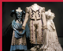
Costumes des Nozze di Figaro d'après A. Claré, Exposition Gabriel Bacquier, baryton, 2014.