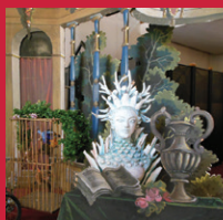
Eléments de décor du Festival d'Aix

Divers événements tels que cycles de conférences sur l'art et l'opéra avec les Amis des Musées d'Aix et les Amis du Festival, actions de médiation et concerts, sont également proposés tout au long de l'année.