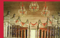
A. M. Cassandre, Lithographies du Décor de la salle de bal, extraites du recueil « Décor de Don Juan » de P. J. Jouve, Genève, Kister, 1957.

Il s'agit de six pièces de style Bérain (Jean I Bérain (1638-1711), ornementiste et décorateur de la cour de Louis XIV), tissées d'après les cartons de Jean-Baptiste Monnoyer vers 1689.