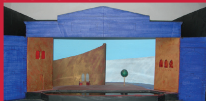
Maquette en volume du Comte Ory, Festival d'Aix, 1995.

Ces collections principalement issues des productions du Festival d'Aix, de sa création aux années 1990, comportent des costumes, des éléments de décor et des maquettes de décors et de costumes, conçus par de grands artistes et scénographes (Cassandra, Balhus, Masson, Ganeau, Malcès, Matias, Platé, Cantafora...). Des expositions temporaires sont régulièrement organisées pour faire découvrir ce fonds dont la fragilité ne permet pas l'exposition permanente.