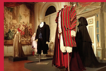
Costumes de Don Giovanni d'après A. M. Cassandre, Festival d'Aix, 1949.

Danseurs et musiciens évoluent dans un décor théâtral composé de bouquets, d'oiseaux, de rinceaux entrecroisés, de baldaquins, de tentures, et de divers ornements caractéristiques du style grotesque. Ces tapisseries ont inspiré à l'artiste Cassandre les décors de la « Salle du Festin » pour le Don Giovanni de Mozart présenté lors du Festival d'Art Lyrique de 1949.