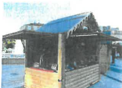
Auvent latéral (côté droit ou gauche)