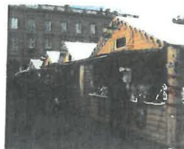
Option : toit blancs