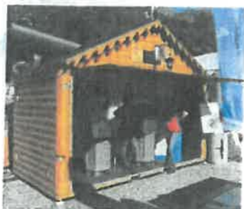
Ouverture totale en façade possible sur tous les modèles