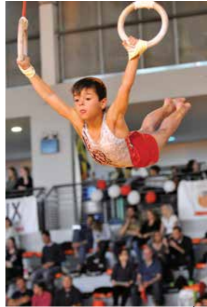
LES POUSSINS DU PAYS D'AIX ARRIVENT 1 ERS AU CHAMPIONNAT RÉGIONAL ORGANISÉ AU GYMNASSE LOUISON BOBET LE 19 AVRIL DERNIER.