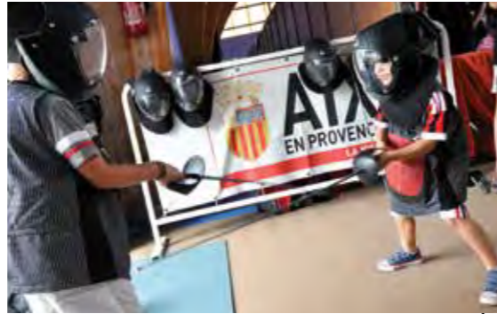
LE SALON DES SPORTS SUSCITE CHAQUE ANNÉE DES VOCATIONS SPORTIVES CHEZ LES PETITS COMME CHEZ LES GRANDS.