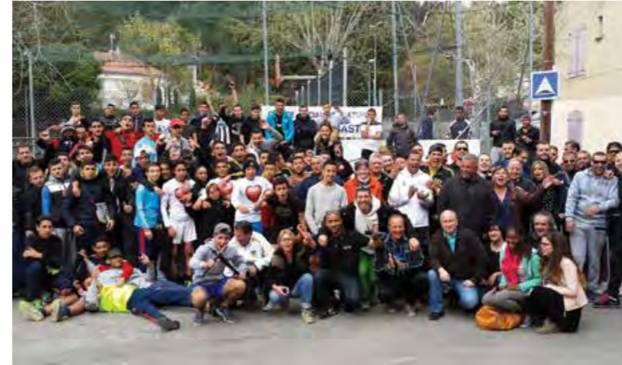
JEUNES ET MOINS JEUNES ONT PARTICIPÉ AU 1ER TOURNOI DE FOOT CARITATIF ORGANISÉ PAR LE CALVSA AU PROFIT D'UNE FAMILLE DU VAL SAINT ANDRÉ.

NOTEZ LE ! LE 6 SEPTEMBRE : ASSOFORUM, LE SALON DE LA VIE ASSOCIATIVE DU QUARTIER, SE TIENDRA LE MATIN DANS LES JARDINS DE LA MAIRIE ANNEXE, L'APRÈS-MIDI DANS LES LOCAUX DU CAP.