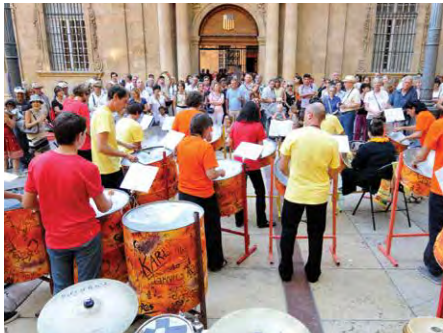
TEMPS FORT DE LA VIE MUSICALE D'AIX-EN-PROVENCE, MUSIQUE DANS LA RUE VIENT CLORE LA SAISON ESTIVALE ET ANNONCER AVEC DOUCEUR LA RENTRÉE.