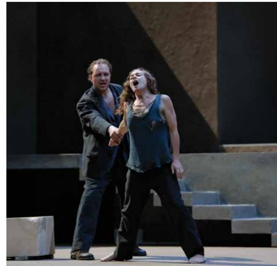
© Elektra, Festival d'Aix-en-Provence 2013