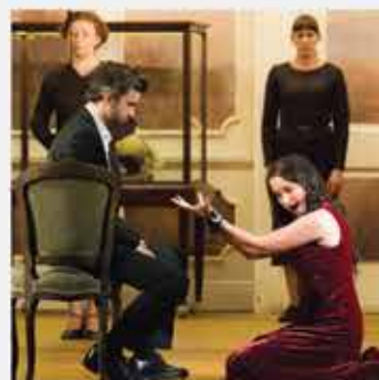
de l'opéra avec LE FESTIVAL INTERNATIONAL D'ART LYRIQUE 30 juin > 20 juillet