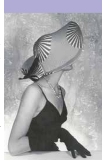
© Robe Jacques Fath / Association Willy Maywald - ADA GP

Il a côtoyé les plus grands peintres de son époque,