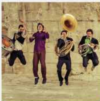
de la musique avec MUSIQUE DANS LA RUE 20 > 27 août