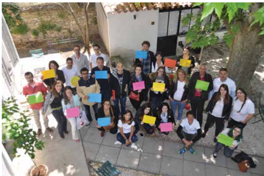
GOJOB A ORGANISÉ À AIX UN CASTING À L'EMPLOI. A LA CLEF : 10 CDI.

Toutes les infos sur https://gojob.com ou en téléchargeant l'application Gojob