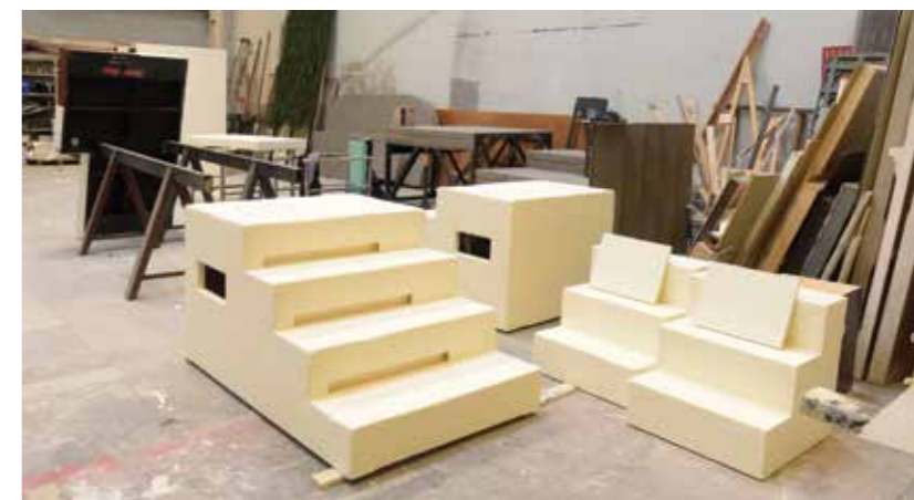
Festival d'Aix-en-Provence

éléments du décors fabriqués à Venelles partiront probablement en tournée aux États-Unis. Des fragments d'Aix s'exporteront ainsi sur le sol américain.