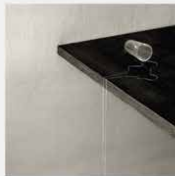
de la photo avec CHEMA MADDOZ 30 juin > 2 octobre au Pavillon de Vendôme