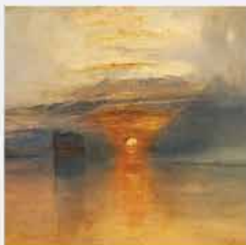
de l'impressionnisme avec TURNER ET LA COULEUR 4 mai > 18 septembre au Centre d'Art Caumont