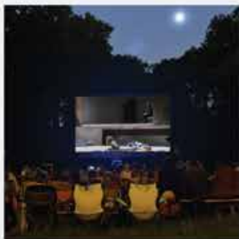
du cinéma de plein air avec LES INSTANTS D'ÉTÉ 3 juillet > 28 août