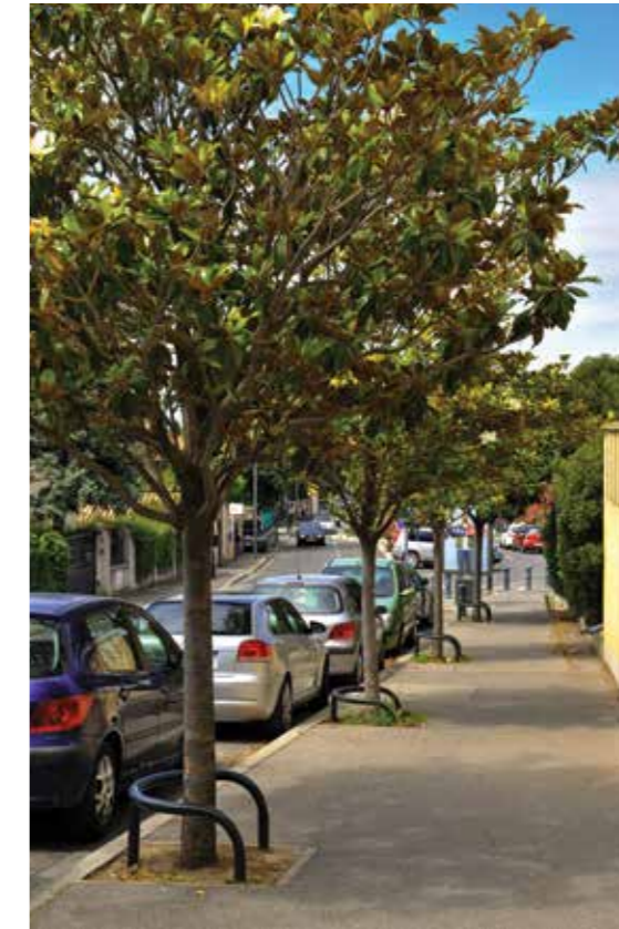
DES MAGNOLIAS, PLANTÉS DANS LES ANNÉES 90 DEVANT L'HÔPITAL.

d'alignements des grandes artères, souvent centenaires. Les plantations ont également été très nombreuses lorsque les ensembles de la ZUP, de la ZAC ou plus récemment de Sextius Mirabeau ont été lancés. Environ 700 à 800 arbres ont été plantés chaque année. Aujourd'hui les grandes greffes urbanistiques sont achevées et parallèlement, les platanes sont plus vieux, et les expertises systématiques. Pour autant il y a encore davantage de plantations que d'abattages, environ deux fois plus sur les dix dernières années.