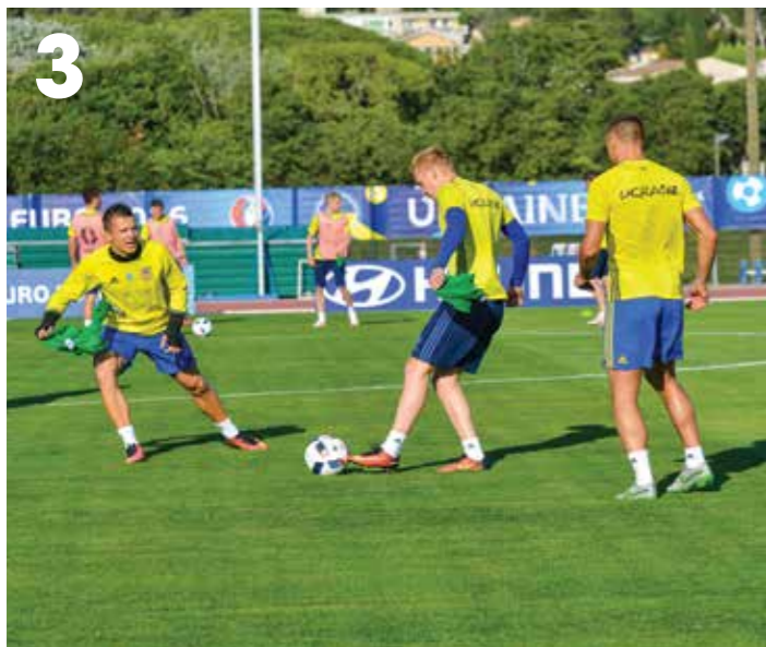
Le musée du palais de l'Archevêché revient sur la création du festival d'Aix avec une exposition de peintures, décors et costumes (1). Les Allées Provençales accueillent début juin les 1 ères Estivales de l'immobilier et de l'aménagement urbain (2). Côté sport, l'Euro 2016 s'invite à Aix le 8 juin avec l'équipe d'Ukraine (3) et le mythique Andreï Chevtchenko (4), ballon d'or 2004 ; les Argos (5) accèdent le 12 juin à la finale Sud du championnat de France de football américain, et la fête du Pass'Sport Club (6) agite le Val de l'Arc le 15 juin.