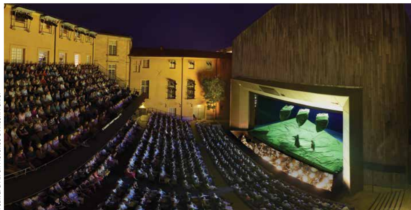
Festival d'Aix-en-Provence