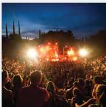
des concerts avec LE FESTIVAL ZIK ZAC 21 > 23 juillet au Théâtre de verdure