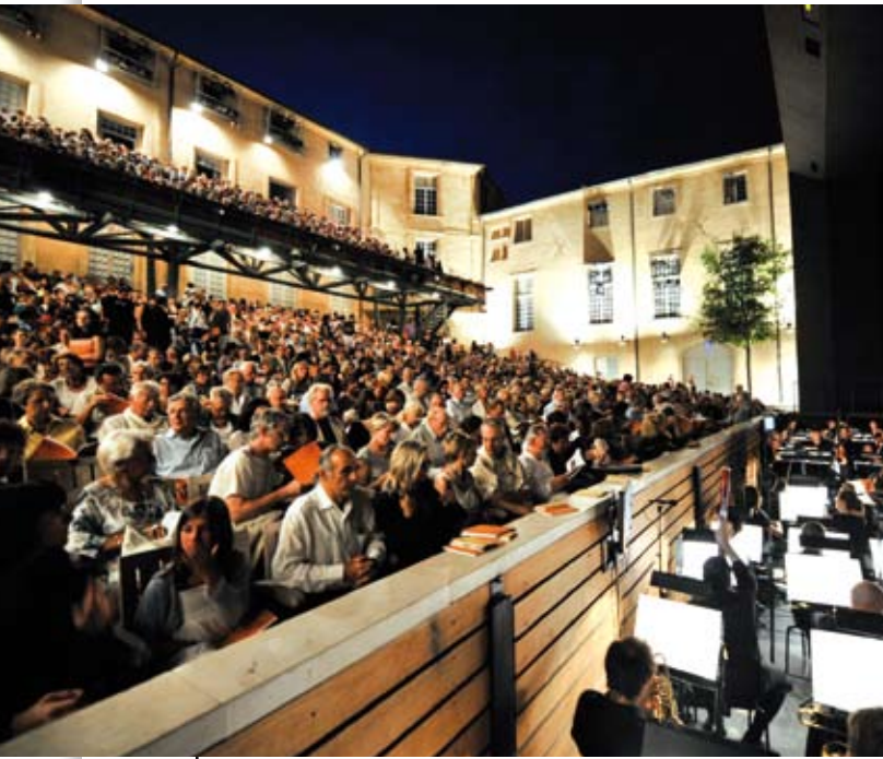
Aix-en-Provence attire de plus en plus de monde, grâce à une offre culturelle qui dépasse les frontières de la Ville (ici le Festival d'Art Lyrique).