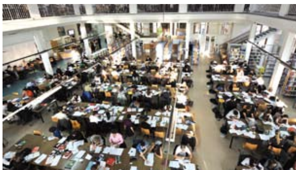
Les 40 000 étudiants contribuent fortement au rayonnement international d'Aix-en-Provence, mais la ville semble atteindre aujourd'hui ses limites en matière d'accueil résidentiel. D'où la volonté de mener une réflexion complète sur le sujet avec l'adoption récente du Plan campus.